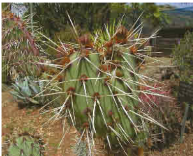
Jon Sullivan - Wikipédia