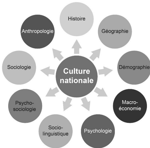
Figure I.1 Les disciplines de sciences sociales et sciences humaines permettant de décoder une culture

Le lecteur retrouvera dans cet ouvrage la méthodologie d'Itinéraires Interculturels = (i) 2 dans l'approche des cultures et leurs influences sur le monde professionnel et les relations sociales : le décodage des cultures danoise, islandaise, norvégienne et suédoise à partir de l'interaction entre les différentes disciplines de sciences sociales et sciences humaines (voir figure I.1).