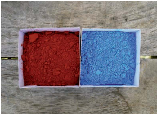
Pour faire du bleu nuit.

Pour les boiseries extérieures, pour préparer de très beaux bleus, qui tendent vers le vert ou vers le gris, il faut toujours mélanger au bleu du jaune et une pointe de rouge. Selon les proportions de jaune ou de rouge on obtiendra toute une gamme très riche. On procédera de la même façon pour les autres couleurs.