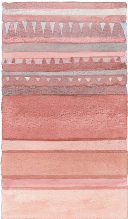
Roses et gris.

Un fond jaune est excellent aussi pour l'application d'un rouge sombre ou d'une terre de Sienne brûlée. La couleur devient chatoyante, moirée, très chaleureuse.