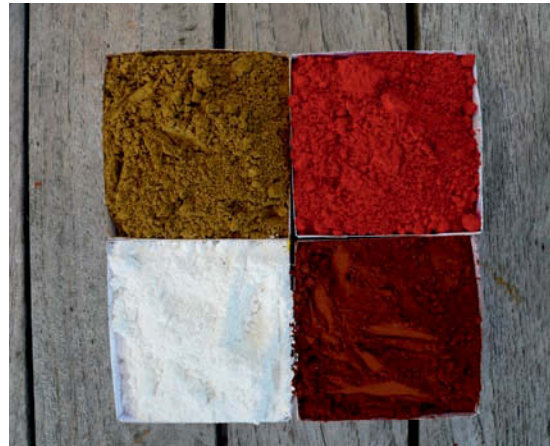
Pour faire un très beau rouge.

« Il faut employer un nombre aussi réduit que possible de substances colorantes et l'on ne saurait trop recommander pour les appliquer la méthode la plus simpliste. L'harmonie est obtenue plus difficilement par plusieurs pigments que par un petit nombre. » (J. W. v. Goethe, Traité des couleurs. )