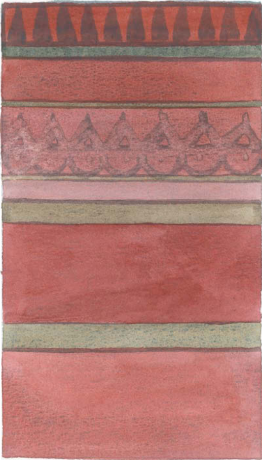
Rouges et verts.

Quand deux couleurs sont en contact, elles agissent l'une sur l'autre, au point de modifier leur aspect et leur intensité. Si l'on veut associer deux couleurs, la loi des complémentaires sera appliquée pour obtenir un ensemble harmonieux. Ainsi, dans l'association du jaune et du bleu, il faudra du rouge dans le jaune ou dans le bleu pour que cette combinaison de couleurs soit agréable. Si toute trace de rouge est absente, nous aurons un ensemble pauvre, très éloigné de la totalité, de l'unité ressentie dès que toutes les couleurs sont réunies.