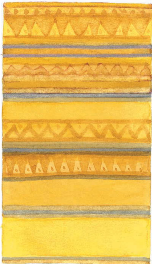
Jaunes et bleus.