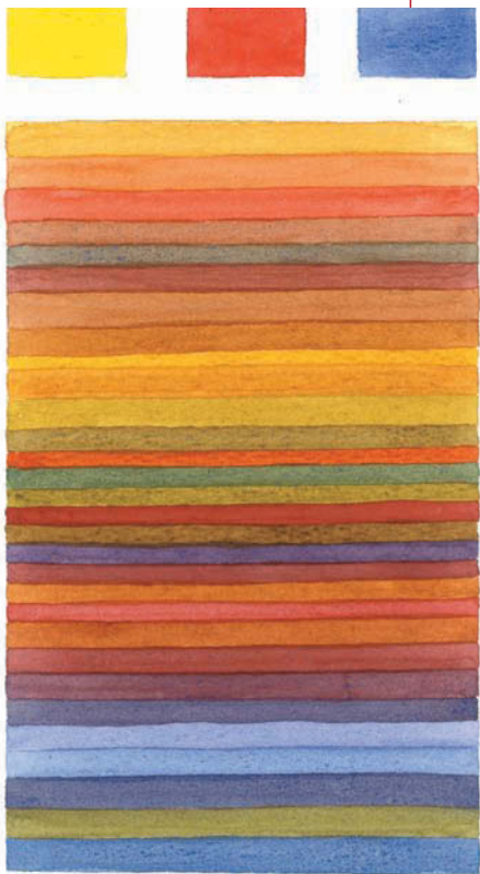
Toutes ces couleurs sont faites avec seulement les trois couleurs primaires.