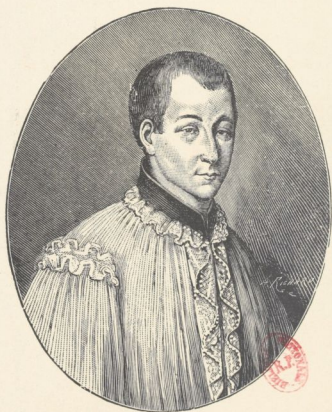
LE BIENHEUREUX CLAUDE DE LA COLOMBIÈRE (1641-1682)