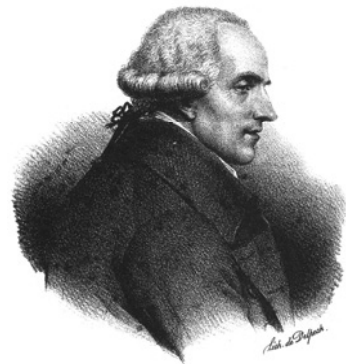
Pierre-Simon Laplace 1749-1827

Son nom reste attaché à la théorie du déterminisme suivant laquelle l'avenir du monde est entièrement déterminé par son état actuel.