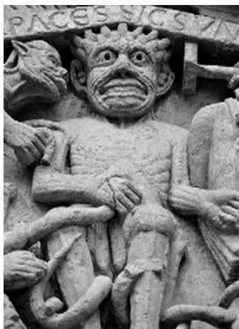
S te Foy de Conques, tympan du « jugement dernier » : Satan, Prince de l'enfer préside le monde du mal.