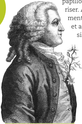
Le grand Linné, fondateur de la systématique, père de l'écologie...

papillons et attrapaient des hannetons pour les martyriser. Avec le temps, les peintres se sont progressivement mis à les illustrer parmi les bouquets de fleurs et autres décors champêtres. Dès le début du XVIII e siècle, des collections d'insectes et autres papillons circulaient dans les cabinets de curiosité des notables, ce qui témoigne de l'intérêt croissant pour ces créatures.