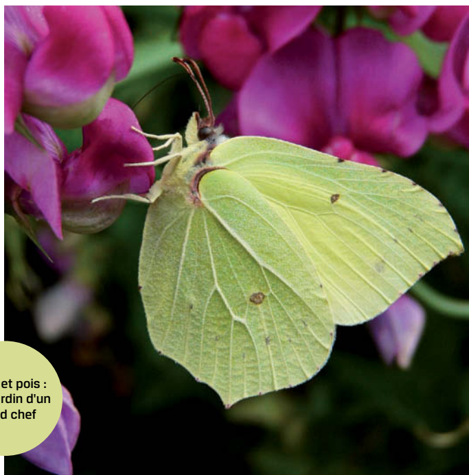
Citron et pois : ou le jardin d'un grand chef

C'est pourquoi, loin du catastrophisme ambiant et des querelles de spécialistes, le simple promeneur et l'amoureux de la nature aimeraient qu'on leur propose des réponses aux questions simples qu'ils se posent parfois au sujet des papillons ... Certes, des problèmes restent en suspens : on ne connaît pas encore, par exemple, la biologie et les mœurs d'une foule d'espèces. Mais l'auteur espère que le modeste apport de connaissances proposé ici aura permis au lecteur d'en savoir décidément un peu plus sur ces charmants insectes.