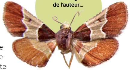
Zitha agnielealis : filleule malgache de l'auteur...