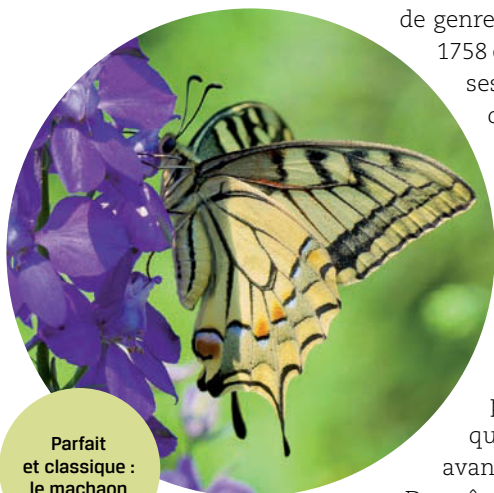
Parfait et classique : le machaon

de genre créé par Carl von Linné en 1758 et qui regroupe de nombreuses espèces joliment ornées – dont la plus connue est le machaon ( Papilio machaon ). Le verbe papillonner (« voltiger ou passer d'un objet ou d'une personne à une autre ») se réfère bien à l'étymologie du mot « papillon », d'où l'expression (récente) : « minute papillon », demandant à quelqu'un un instant de pose avant d'obtempérer.