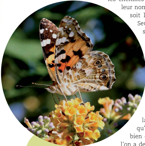
Belle-dame : la belle vanesse des chardons

Avec le temps, d'autres sources d'inspiration sont apparues donnant localement des buddha , krishna , zoroastre . Dès Carl von Linné, des espèces furent dédiées à des personnages, collègues, amis, membres de la famille (ou maîtresses !), ou récolteurs zélés que l'on souhaitait honorer. C'est ainsi que des hommes illustres ou de simples inconnus (dont on ne sait rien) ont vu leur nom immortalisé, des jacksoni , sjoestedti et duponti aux abdelkader et mohammed . Certains sont même allés jusqu'à se dédier une espèce (nul n'oserait plus le faire aujourd'hui, semble-t-il). Des noms censés être descriptifs ont aussi été proposés, tels que flavofasciata , minimus ou obscura , mais quand le nombre d'espèces connues dans un genre augmente, ces noms n'apportent aucune information définitive (ils gardent cependant toute leur valeur). Il a aussi été fait allusion à la plante-hôte, lorsqu'elle était connue. Cependant, combien de populi se développent sur plusieurs essences, en plus du peuplier, et la piéride de la moutarde ( Leptidea sinapis ), par exemple, ne se développe pas sur cette plante mais sur diverses gesses (Fabaceae)... Là aussi, le nom savant reste précieux car il distingue opportunément