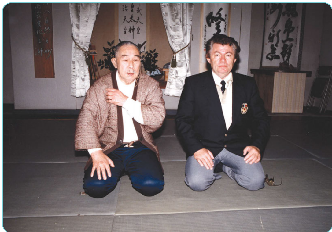
L'auteur avec maître Minoru Mochizuki.