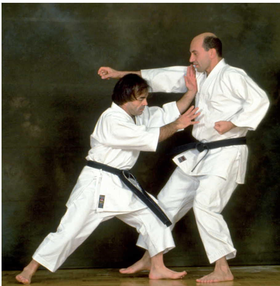
Exemple d'attaque dans l'attaque.