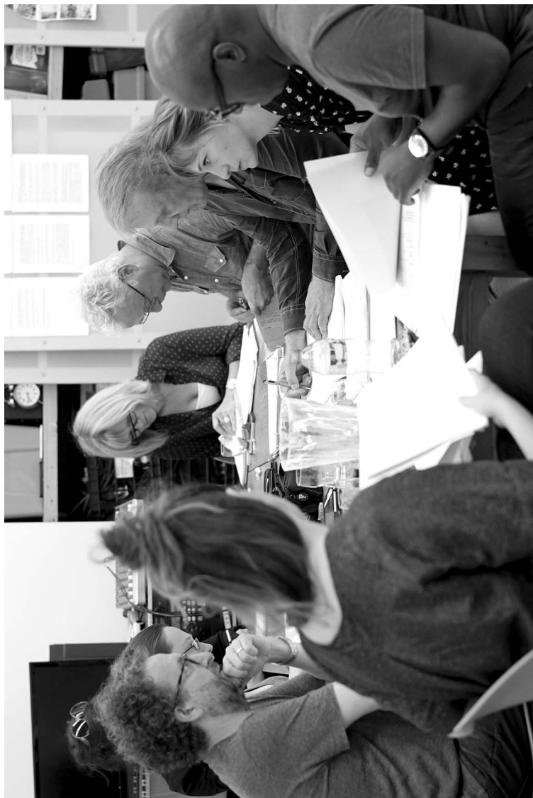
Casting au complet lors de la répétition du 27 juin 2017.