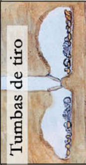
Tumbas de tiro

El Opeño, un sitio aldeano localizado en el noroeste del estado de Michoacán, México, del cual solamente se conocen sus tumbas y sus ofrendas.