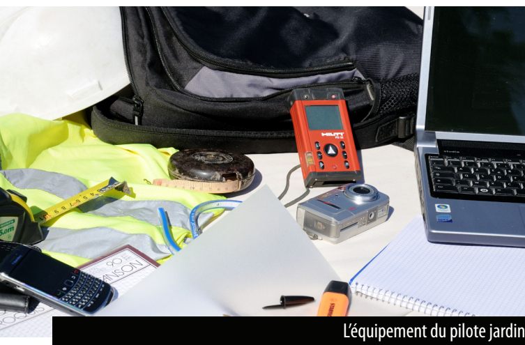
L'équipement du pilote jardin

Cette thérapie existe grâce à des parcours sensoriels, à des jardins d'éveil, à des espaces sécurisés et spécialement conçus.