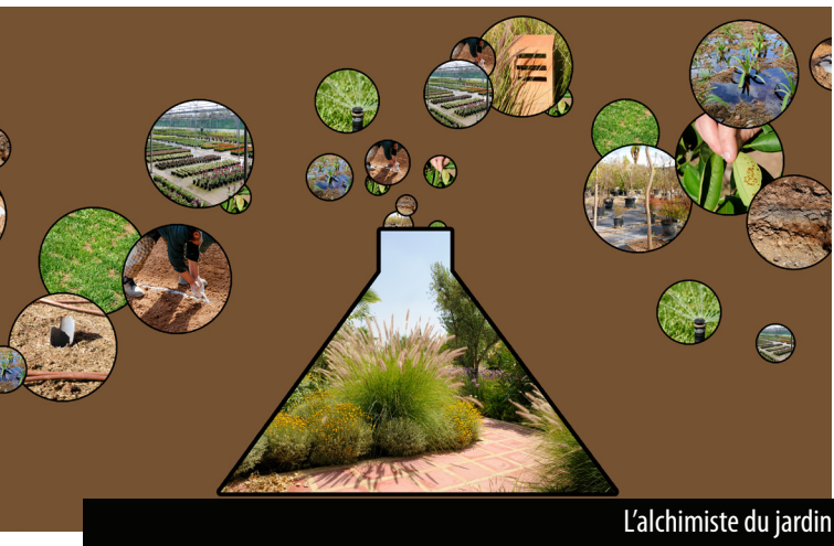
L'alchimiste du jardin

Ce mot évoque de la magie. Certainement, le rôle principal de l'alchimiste du jardin consiste à résoudre toutes les contraintes d'un projet paysager pour que l'œuvre soit réussie.