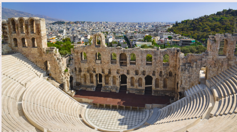
Odéon d'Hérode Atticus.