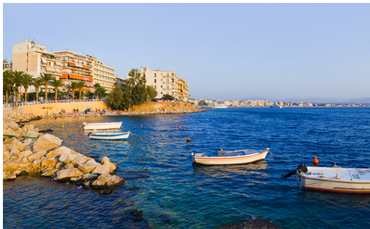
Lac de Voulagmeni.

Mais Athènes est aussi une destination culturelle de première classe, évidemment. Le centre-ville, dominé par le rocher de l'Acropole, détient un patrimoine archéologique hors du commun, bien préservé, cohabitant merveilleusement avec la modernité trépidante de ses habitants et infrastructures.