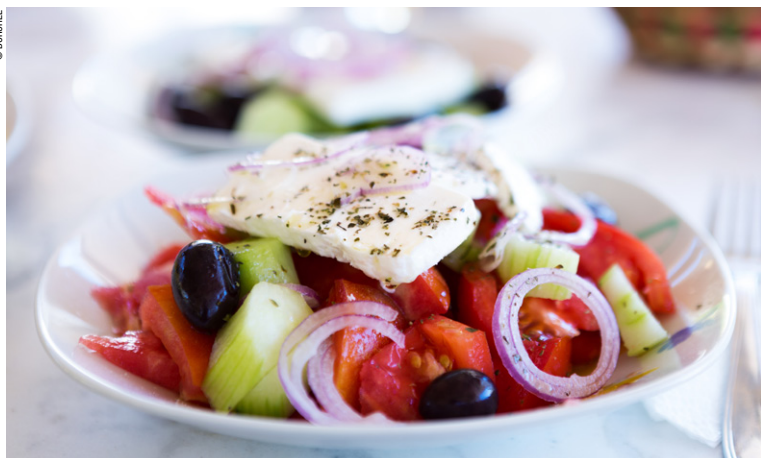
Salade grecque, un classique des tables athéniennes.

Des petits gestes discrets, comme les ftou ftou (fait de postillonner sur quelqu'un pour le protéger du mauvais œil) jusqu'aux inimitables coutumes (la danse des evzones lors de la relève du Parlement) on retrouve cette fidélité des traditions, intemporelles. Il semblerait qu'en Grèce, tout doit suivre une forme de routine rassurante, un geste coutumier adopté par tous et qui fait office de lien commun. Cela est valable pour tout dans la vie quotidienne jusqu'à ses moindres détails – par exemple l'ouzo ne se sert