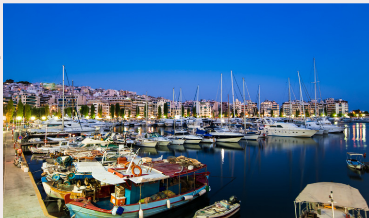
Le port du Pirée.