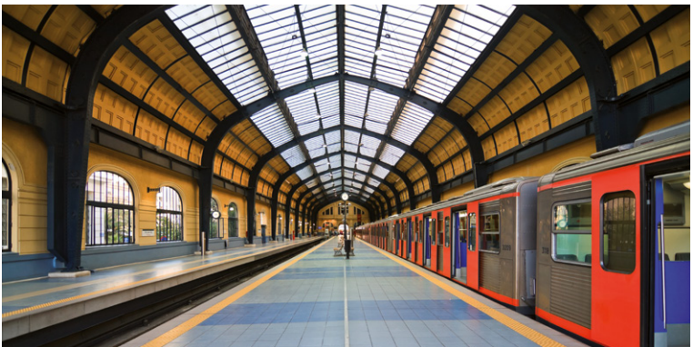
Station de métro du Pirée.

► Autre adresse : Autres agences à Lyon, Toulouse et Marseille.