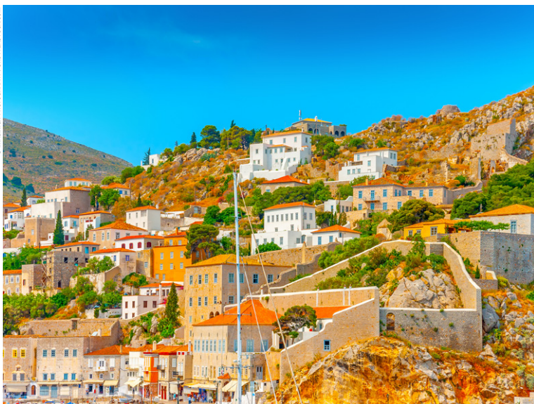
Le port d'Hydra.