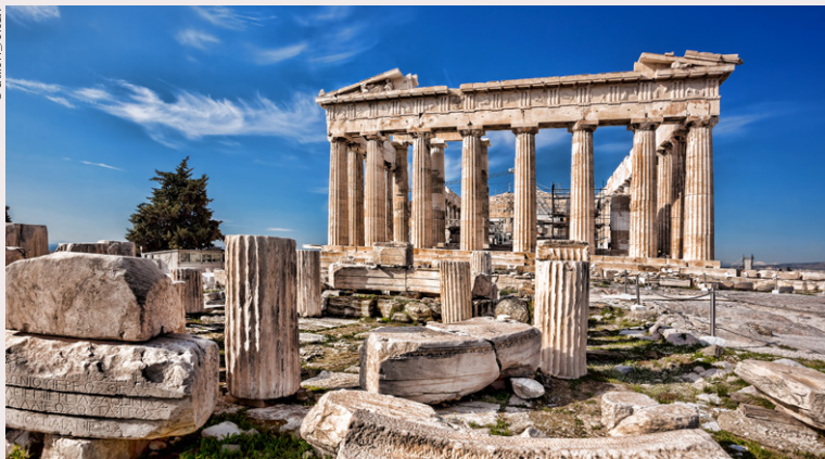
Le Parthénon sur l'Acropole.