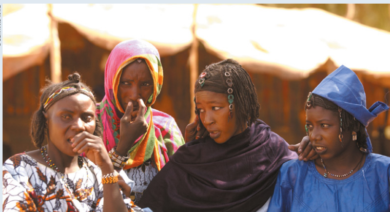
Groupe de femmes touareg.