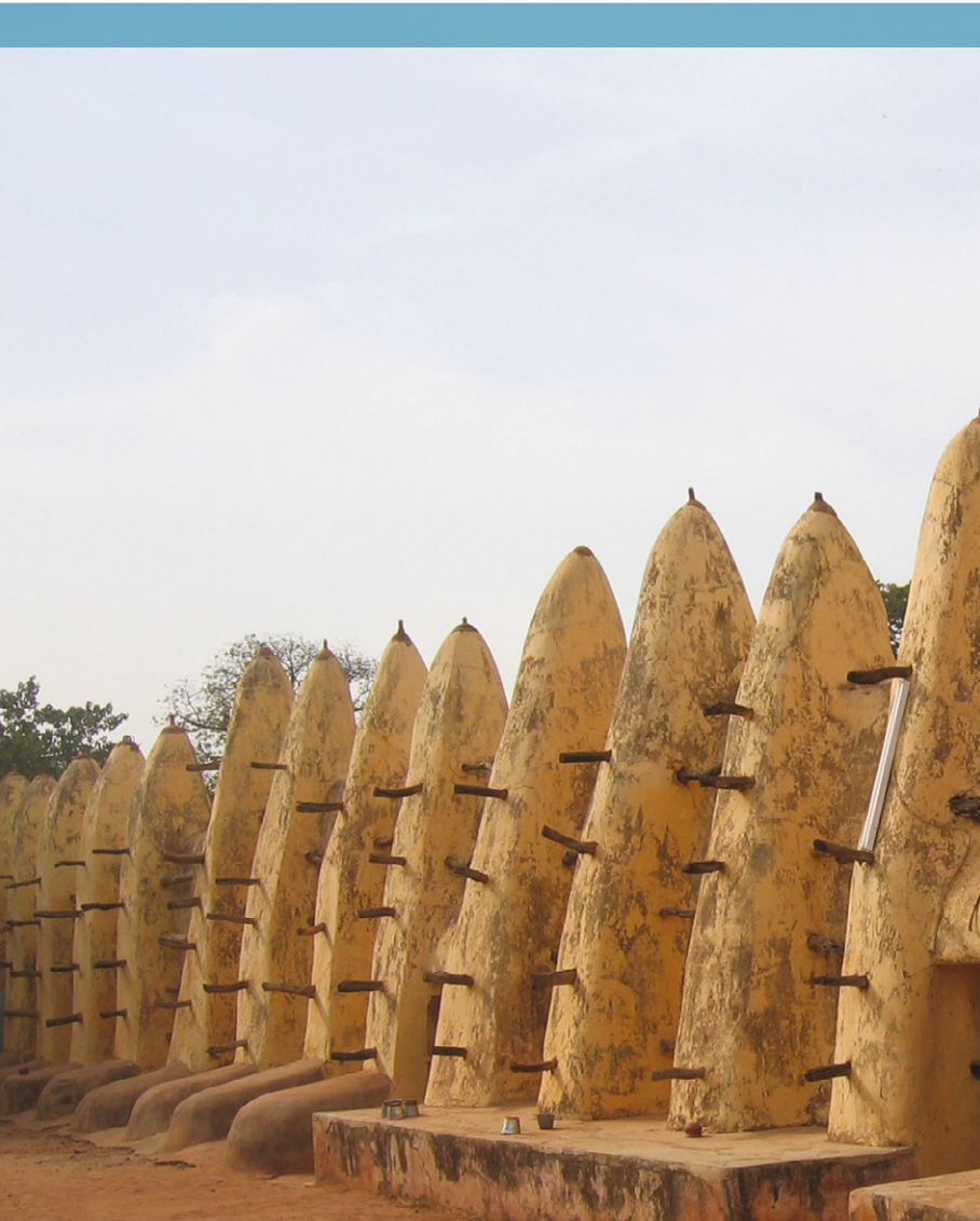
Mosquée de Bobo Dioulasso.