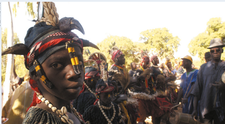
Danses à Salogo.