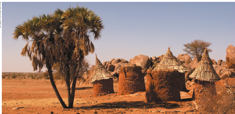
Petit village près de la frontière malienne.