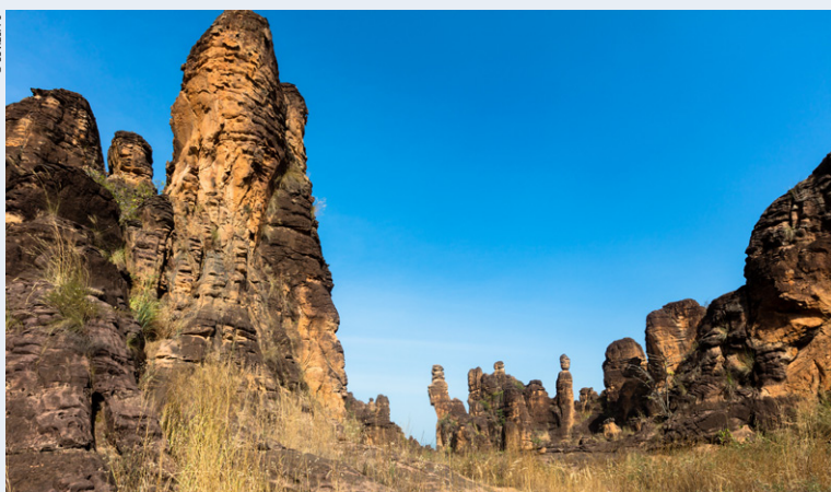
Les Pics de Sindou.