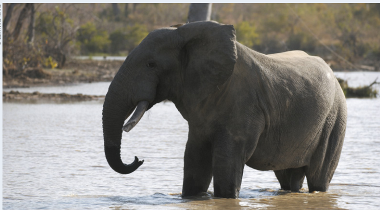
RANCH DE NAZINGA – Éléphant dans le ranch de gibier de Nazinga.