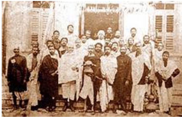
Bangiya Sahitya Parishad 6th December 1908

Ne trouvez-vous pas magnifique cette identité « littéraire » d'un peuple que les occidentaux pourraient considérer de haut ? [sauf Malraux qui s'était ému en son temps des grandes catastrophes] [et il était ministre de la Culture] [comme quoi il y a des ondes de sympathie ou d'antipathie qui courent de par le monde]. Eh bien, pour moi, c'est la génétique de leurs ancêtres qui ressort, à leur plus grand avantage : qui se cultive s'enrichit. Comme vous pouvez le voir pour l'Inde, l'alphabet Bami s'étend sur toute l'Asie du Sud-Est.