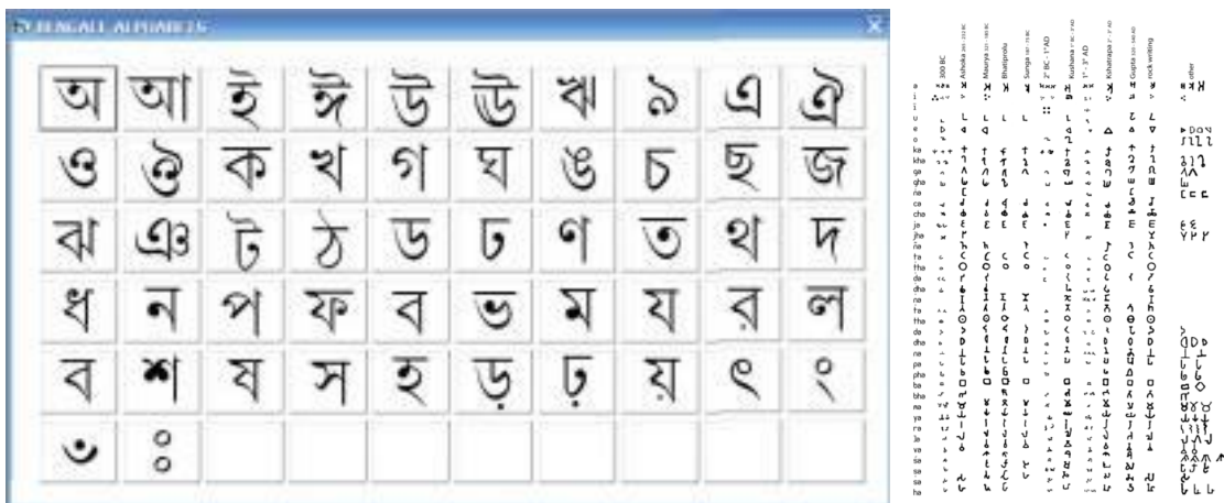
Alphabet bengali Variantes de l'alphabet Bami Glazel ci-dessous

Ne trouvez-vous pas magnifique cette identité « littéraire » d'un peuple que les occidentaux pourraient considérer de haut ? [sauf Malraux qui s'était ému en son temps des grandes catastrophes] [et il était ministre de la Culture] [comme quoi il y a des ondes de sympathie ou d'antipathie qui courent de par le monde]. Eh bien, pour moi, c'est la génétique de leurs ancêtres qui ressort, à leur plus grand avantage : qui se cultive s'enrichit. Comme vous pouvez le voir pour l'Inde, l'alphabet Bami s'étend sur toute l'Asie du Sud-Est.