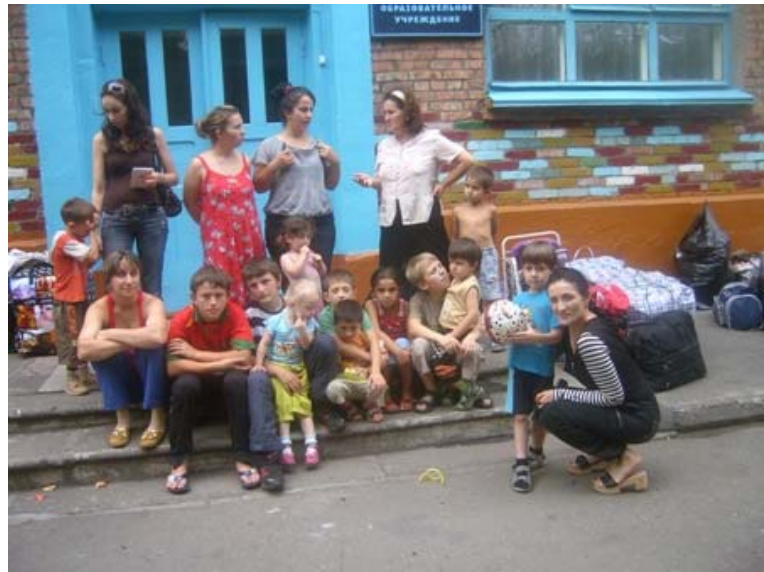
Jeune femme ossète, familles ossètes d'aujourd'hui. Notez la couleur majoritaire des cheveux.

Alains, Yuezhi, Tokhariens et les autres, tous ces peuples cavaliers nomades étaient issus d'une grande Caucase, c'est-à-dire toujours entre mer Caspienne et mer Noire. Là se trouvait donc un énorme rassemblement concrétisé par ces villages de Tcherkassy et autres. Même s'il est étalé dans le temps, ce rassemblement n'en est pas moins fort instructif puisqu'il s'agit en règle générale de peuples indo-européens, ou comme je le traduis, venant de l'Atlantique.