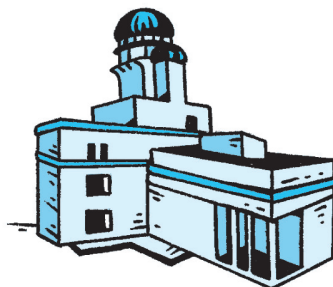
OÙ? Laboratoire de la Sorbonne