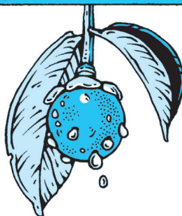
L'ASTUCE la gomme-gutte