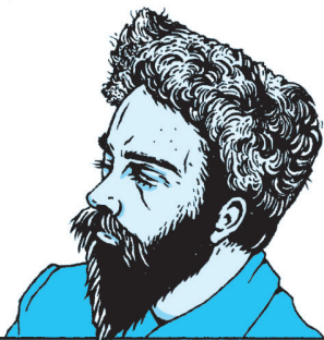
QUI? Jean Perrin