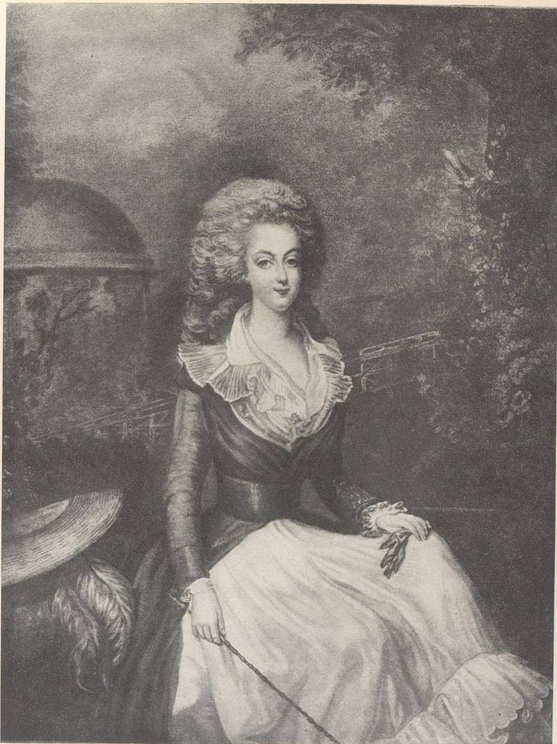
Peinture attribuée à Vestier