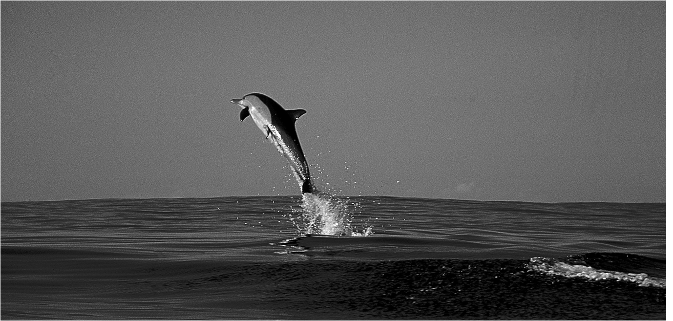
Dauphin commun, Delphinus delphis – Afrique du Sud, Océan Indien