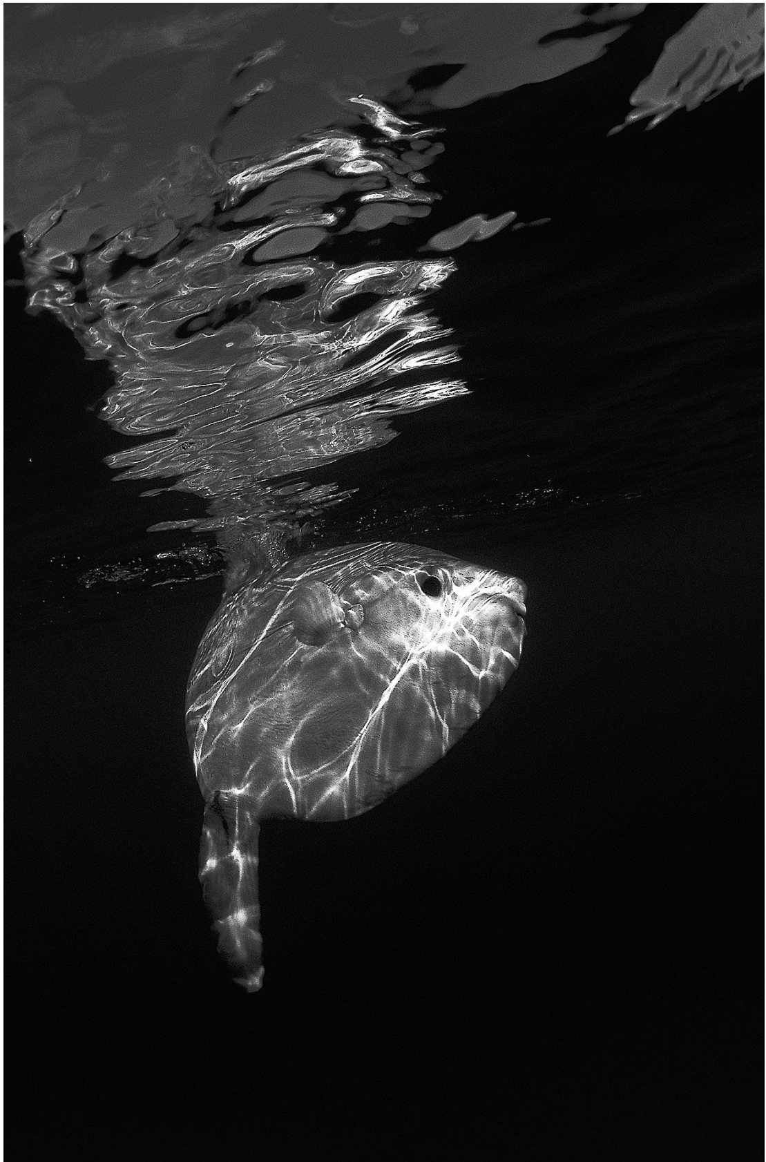
Poisson lune, Mola mola – Marseille, Mer Méditerranée