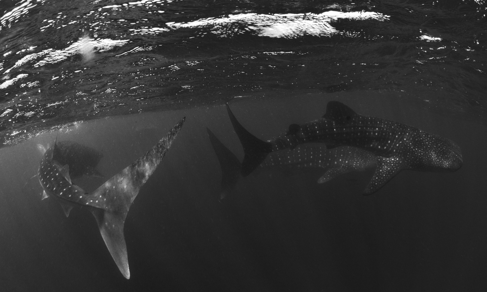
Requin baleine, Rhincodon typus – Djibouti, Mer Rouge