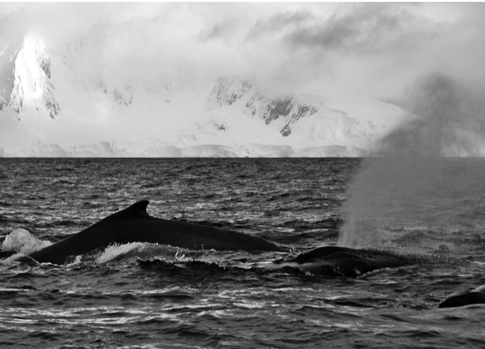
Baleine à bosse, Megaptera novaeangliae – Antarctique