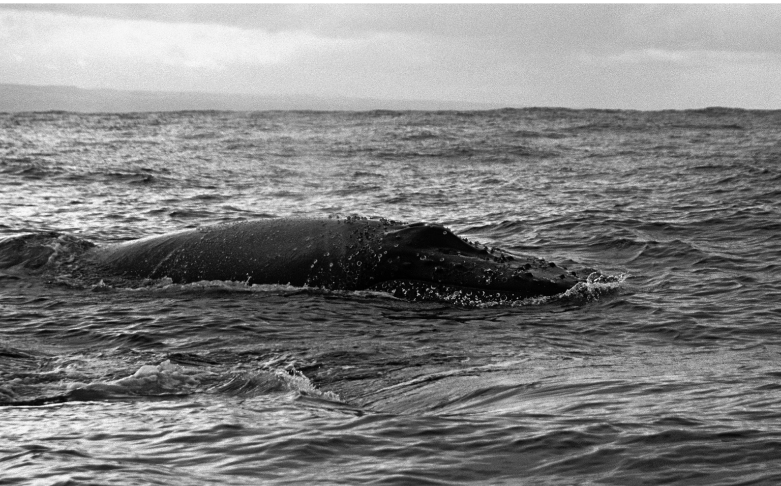
Baleine à bosse, Megaptera novaeangliae – Afrique du Sud, Océan Indien