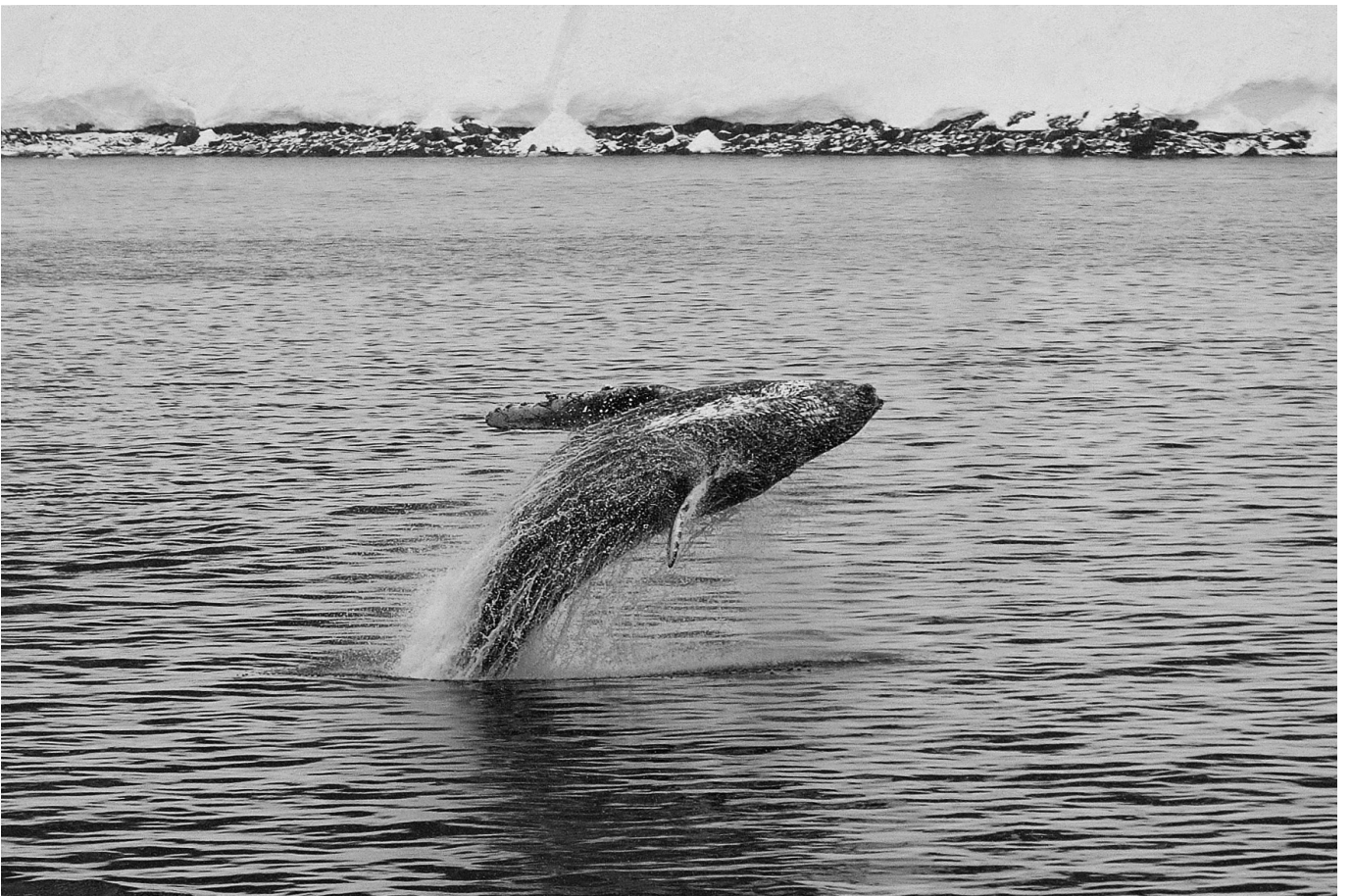
Baleine à bosse, Megaptera novaeanglia – Antarctique