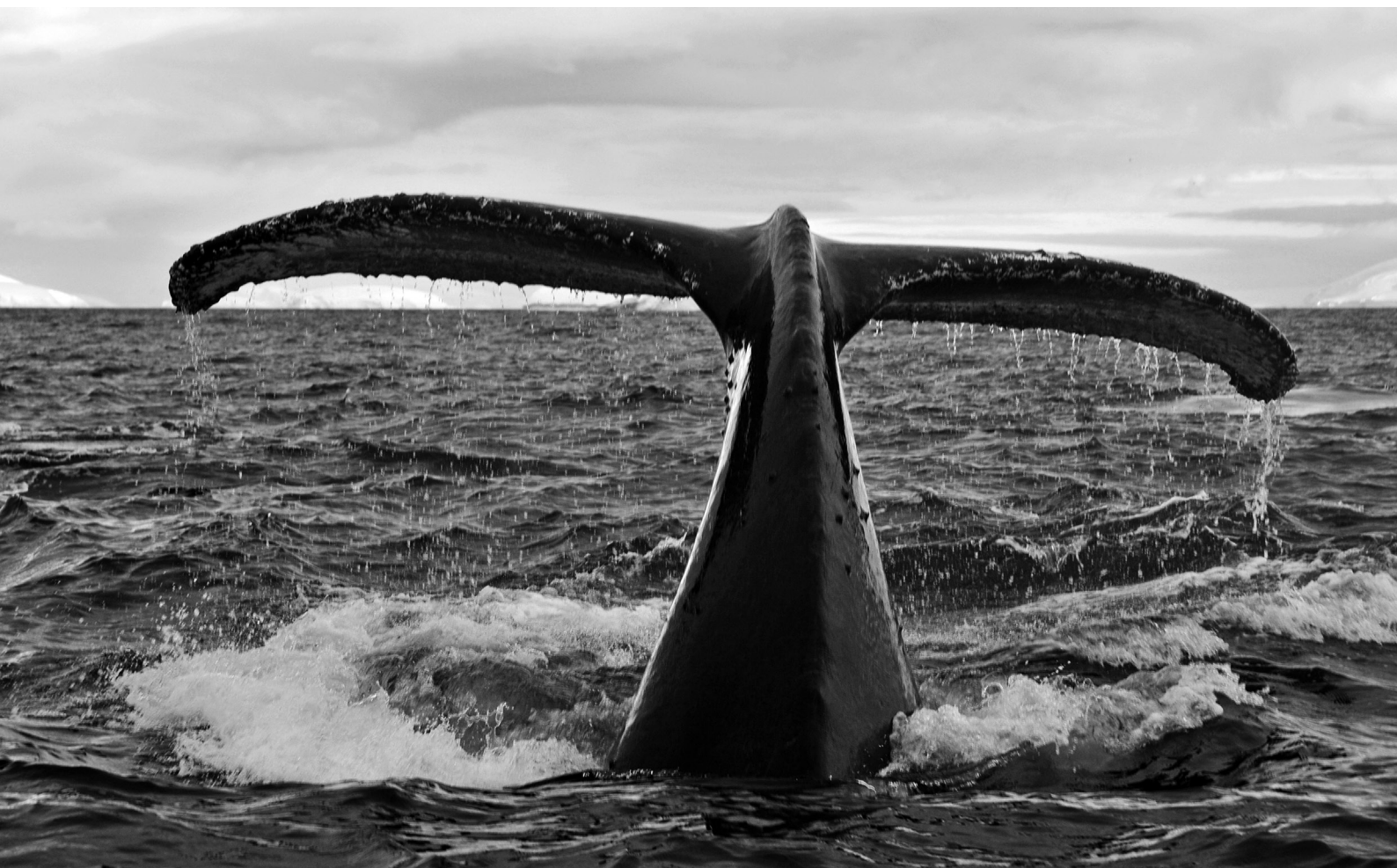
Baleine à bosse, Megaptera novaeangliae – Antarctique