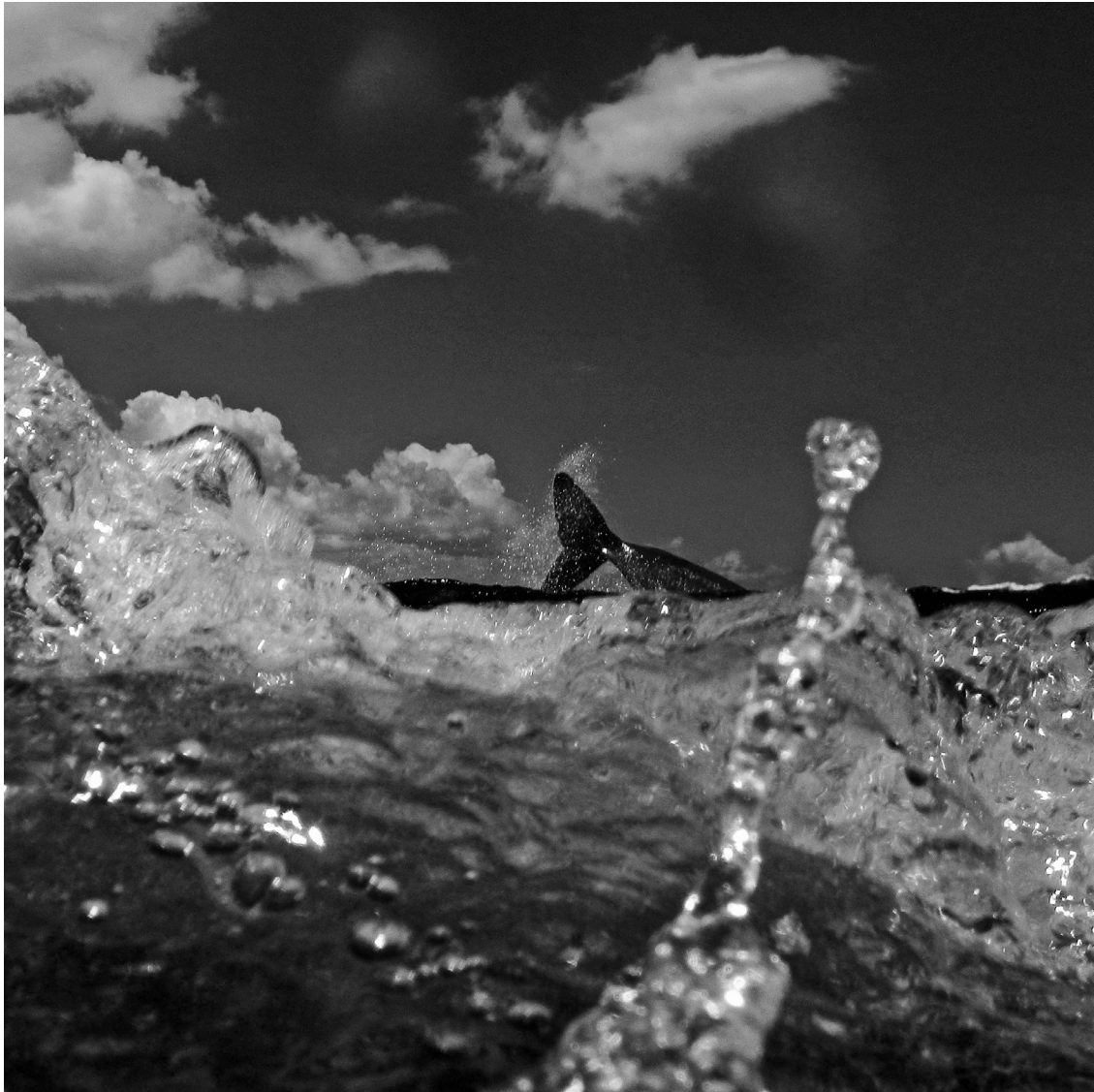
Grand cachalot, Physeter macrocephalus – Île Maurice, Océan Indien