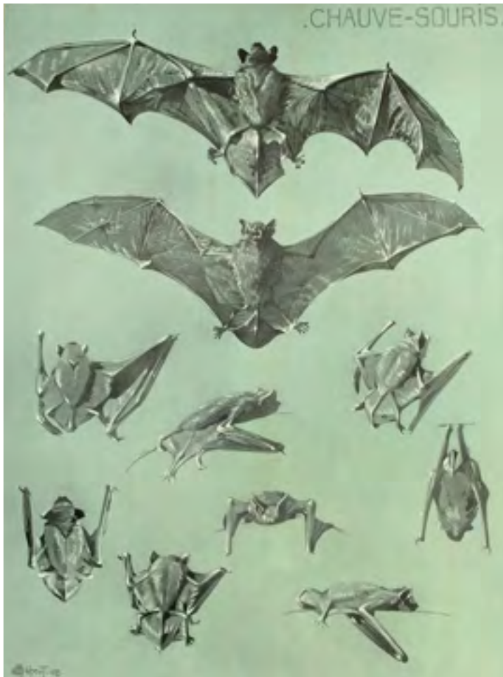
Planche présentant les chauves-souris réalisée par Mathurin Méheut (1882-1958), peintre breton auteur de nombreuses œuvres naturalistes.

Au nom de toute l'équipe bénévole et salariée du GMB et de toutes les personnes ayant contribué à ce travail