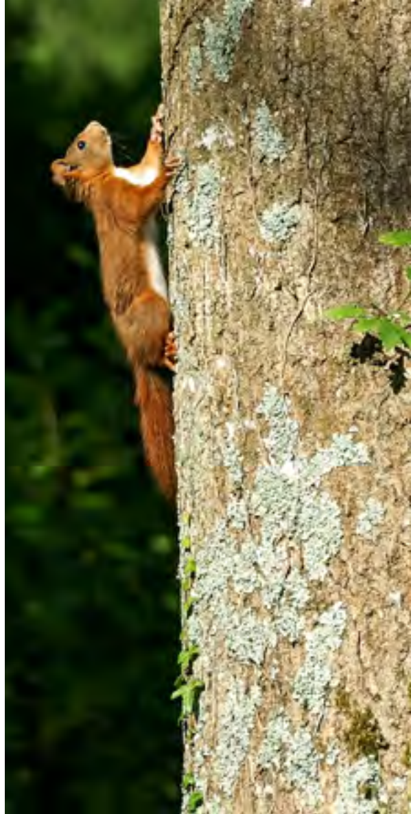
Écureuils roux. Le Trévoux (29) - juin 2010

François Moutou Président d'honneur de la Société Française pour l'Étude et la Protection des Mammifères