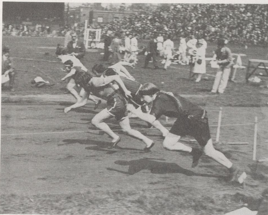
Stamford Bridge Start of the 100 yards Womens Race (Victor Forbin - 1910)