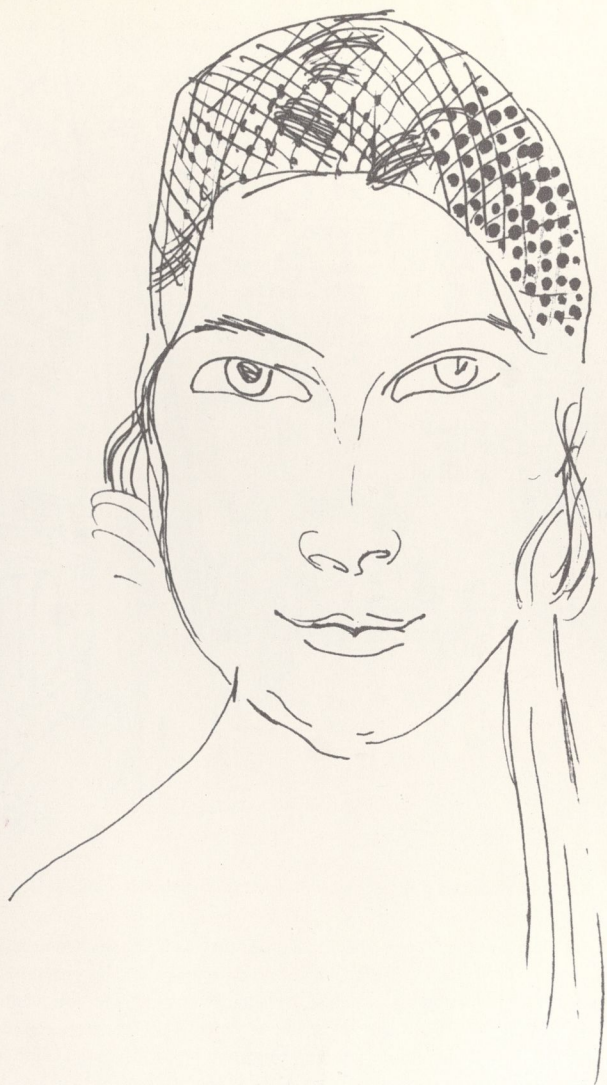
Portrait de l'Italienne Encre de Chine Coll. particulière, Nice