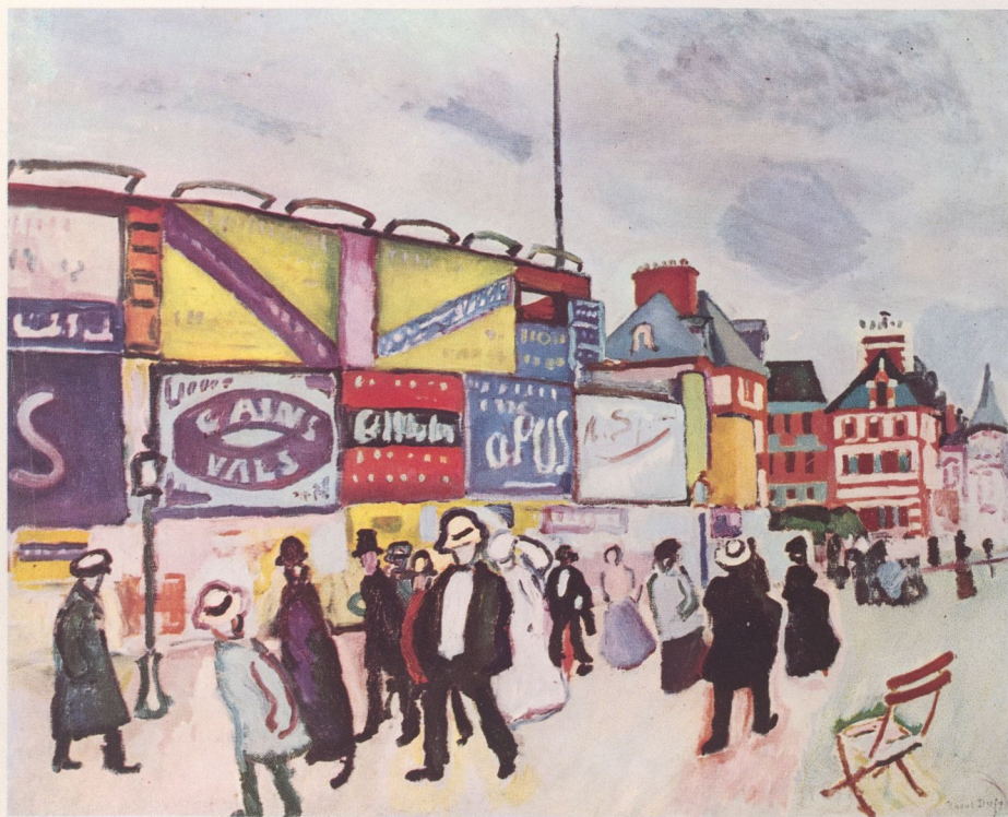
LES AFFICHES DE TROUVILLE, 1906. Huile, 65 x 88 cm. Musée d'Art Moderne, Paris.

▷ LA RUE PAVOISÉE, 1906. Collection particulière, Paris.