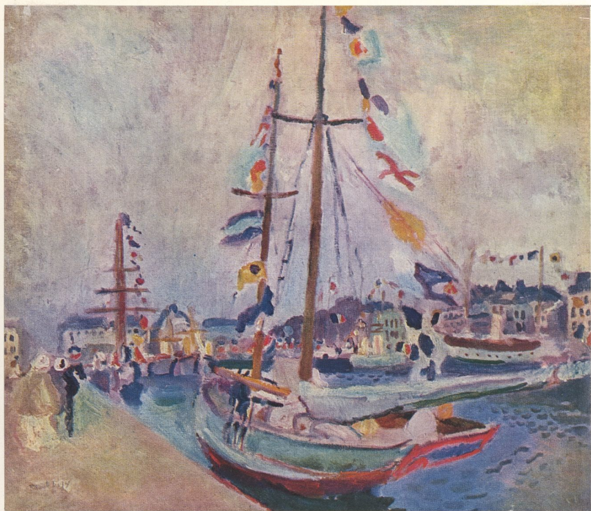
YACHT PAVOISÉ AU HAVRE, 1904. 68 × 80,5 cm. Collection privée, Paris.

Si invraisemblable que cela puisse paraître, Raoul Dufy est un peintre qui a besoin d'être défendu et même, dans une certaine mesure mis en valeur, car son succès est établi, pour une bonne part, sur des malentendus. Il n'est même pas sûr, dans l'état actuel des idées, qu'il soit possible de rétablir la vérité et de faire reconnaître les justes mérites de cet artiste: trop indépendant pour les académismes, il semble trop attaché au réel pour les nouvelles avant-gardes.