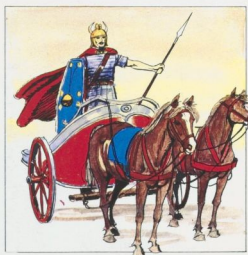
un noble sur son char

125 av. J.-C. les Romains occupent le sud de la Gaule