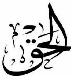
Al Haq – «Le Réel»