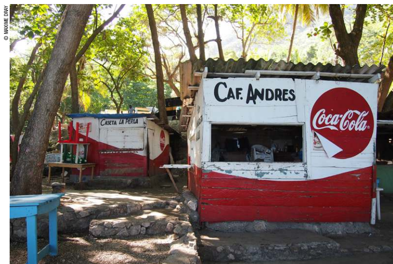
Colmados près d'une plage.

Les cigarettes se vendent à l'unité ou en paquets de dix et de vingt. Et comme elles