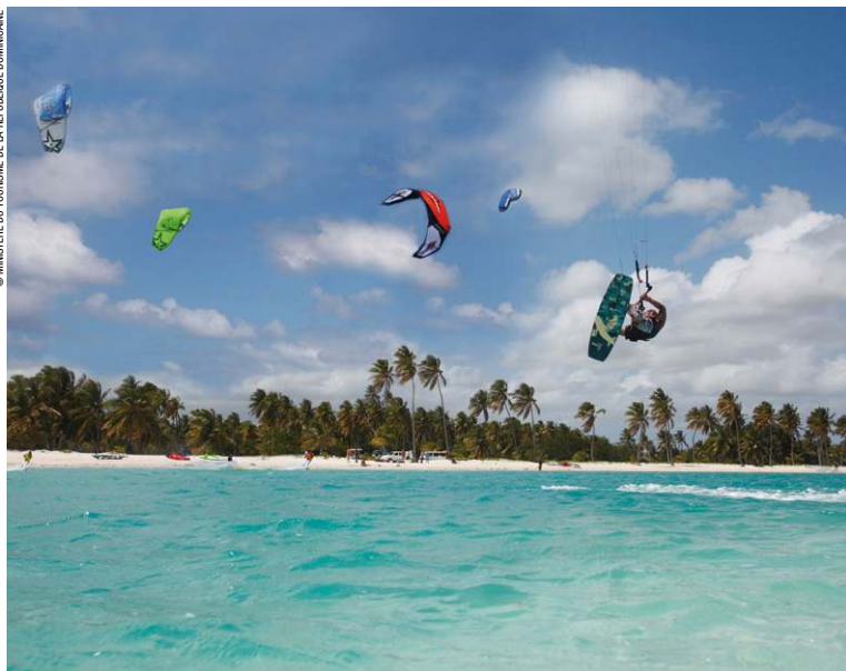
Le kitesurf, un style de glisse très spectaculaire.

Bien que le pays connaisse un hiver d'octobre à mars, celui-ci n'est pas flagrant, et le temps reste très clémente (26 °C de température moyenne) pendant les douze mois de l'année ; pour nous qui sommes habitués aux rigueurs des climats continentaux, la chaleur et le soleil sont au rendez-vous toute l'année. L'été, de