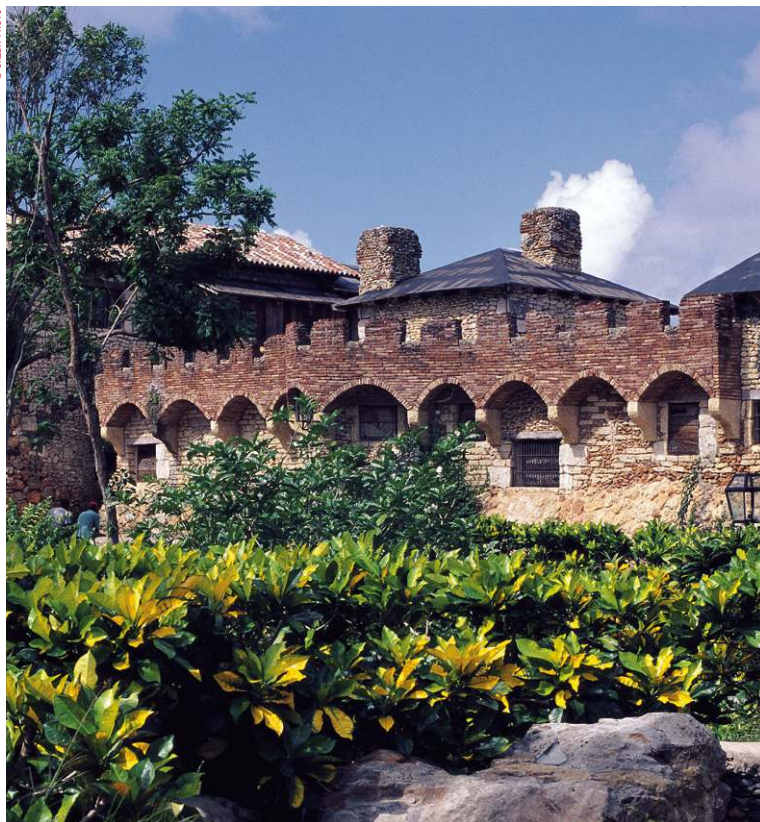
Altos de Chavón.