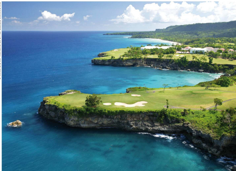
Golf de Playa Grande.