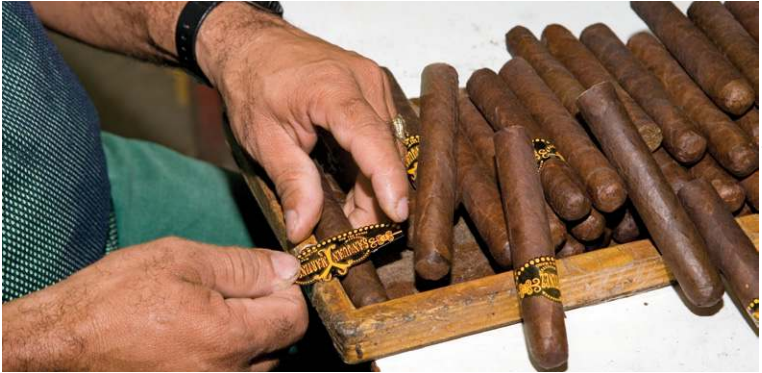
Fabrique de cigares à Santiago.