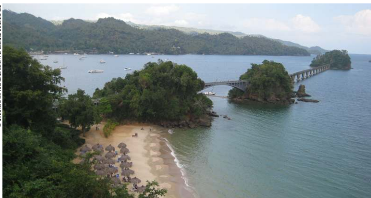
Parc National de Los Haitises, situé dans la baie de Samana.

Le relief et la végétation du pays sont variés. La République dominicaine est traversée par quatre chaînes de montagnes, résultat d'une suite de plissements survenus durant l'ère tertiaire. La cordillère centrale, qui se déploie sur 20 km de largeur pour 100 km de longueur, prend naissance en Haïti sous le nom de massif du Nord. Elle traverse le Centre du pays et s'achève dans le Sud vers San Cristóbal. Le point culminant des Antilles – le Pico Duarte, 3 175 m – se trouve au centre de cette chaîne et voisine avec le pic