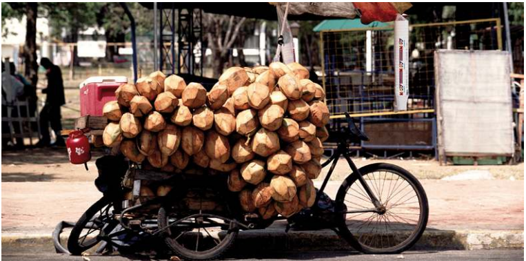
Scène de rue dans la zone coloniale, Santo Domingo.

► Autre adresse : Espace Gaynard 2, place d'Arvieux – 13002 Marseille.