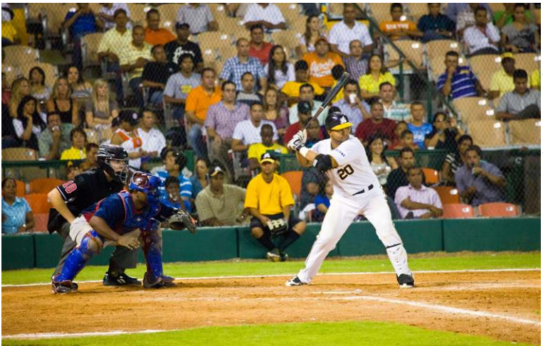
Le base-ball est le sport national.

dance nationale, le 27 février, et de celui de la restauration de la République, le 16 août. A chaque ville, ses masques, ses costumes, ses musiques et ses personnages. Au hit-parade, les Africains, les diables, les poules, les coqs et le calife tiennent le haut du pavé. Les carnivals les plus célèbres sont ceux de Santo Domingo, de San Pedro de Macoris, de Montecristi, de Samaná, de Santiago et de La Vega. Celui de la capitale se termine par une parade haute en couleur sur le Malecón. En fait, ce sont les Espagnols qui ont introduit le Carnaval en République Dominicaine. Dès les années 1520, on retrouve la trace du carnaval de Saint-Domingue. Le contact avec la culture des esclaves africains a enrichi cette fête de musiques, de danses et de chants colorés. Le carnaval est ainsi devenu, au fil des années, un moment de rencontre entre cultures et traditions diverses.