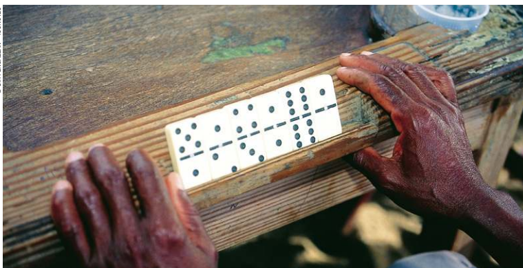
Jeu de dominos.