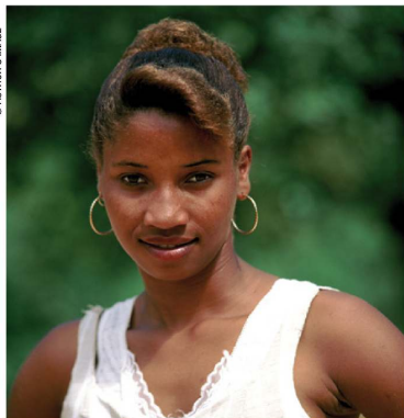
Le charme naturel de la République dominicaine !