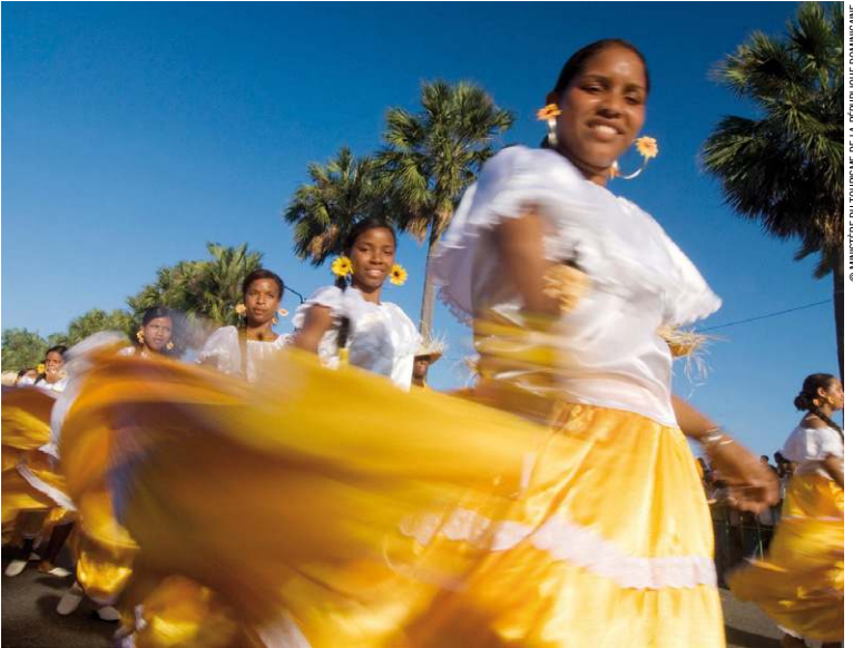
Danseuses de merengue.

mai à septembre, est plus chaud et humide et la période cyclonique (de juillet à octobre) connaît parfois des pluies violentes, mais de courte durée. Les températures dans le centre montagneux sont quant à elles beaucoup plus basses, et il n'est pas rare de descendre en dessous de 0 °C, notamment au sommet du Pico Duarte. La région de Jarabacoa est l'une des zones les plus humides sur Hispaniola, et possède l'amplitude thermique la plus importante. De 14 °C en hiver à 30 °C en été.