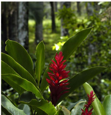
Fleur Alpinia purpurata (jengibre rojo).