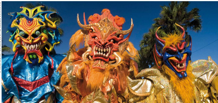
Le carnaval est une fête populaire très mobilisatrice en République dominicaine.