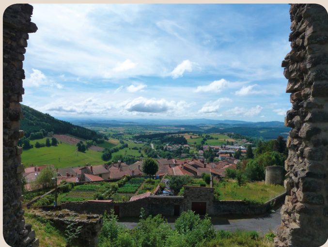
Vue de Mont-Bar.