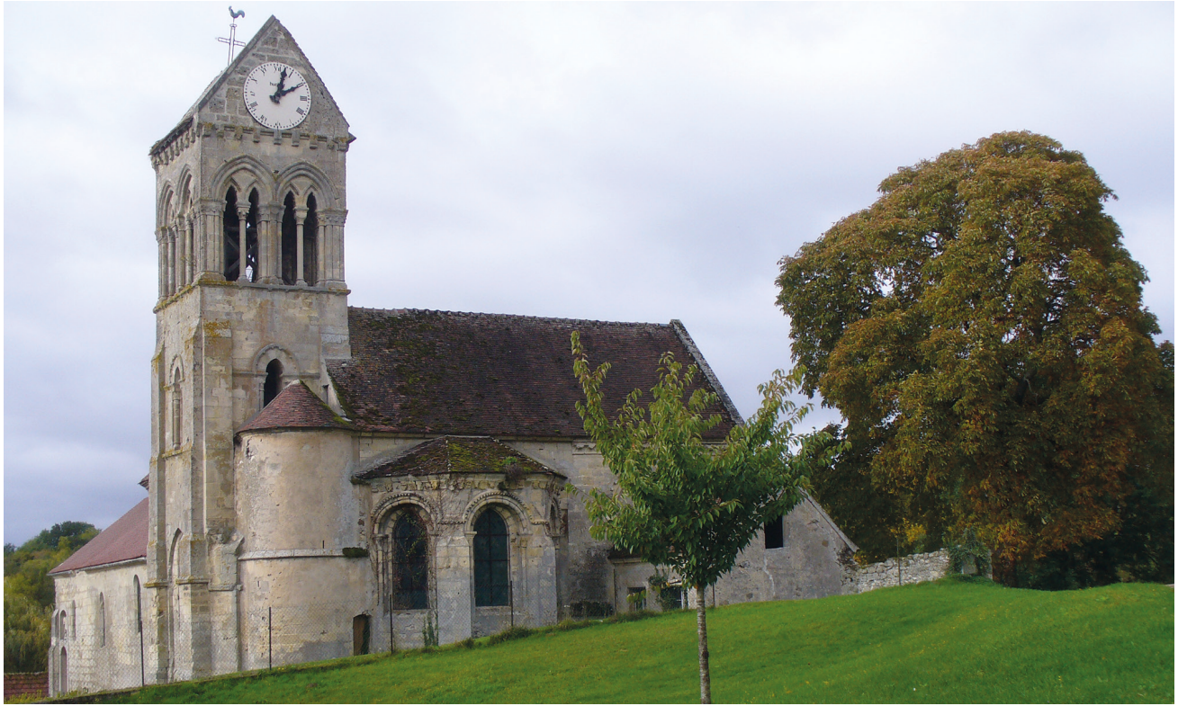
Église de Bonnevalyn.