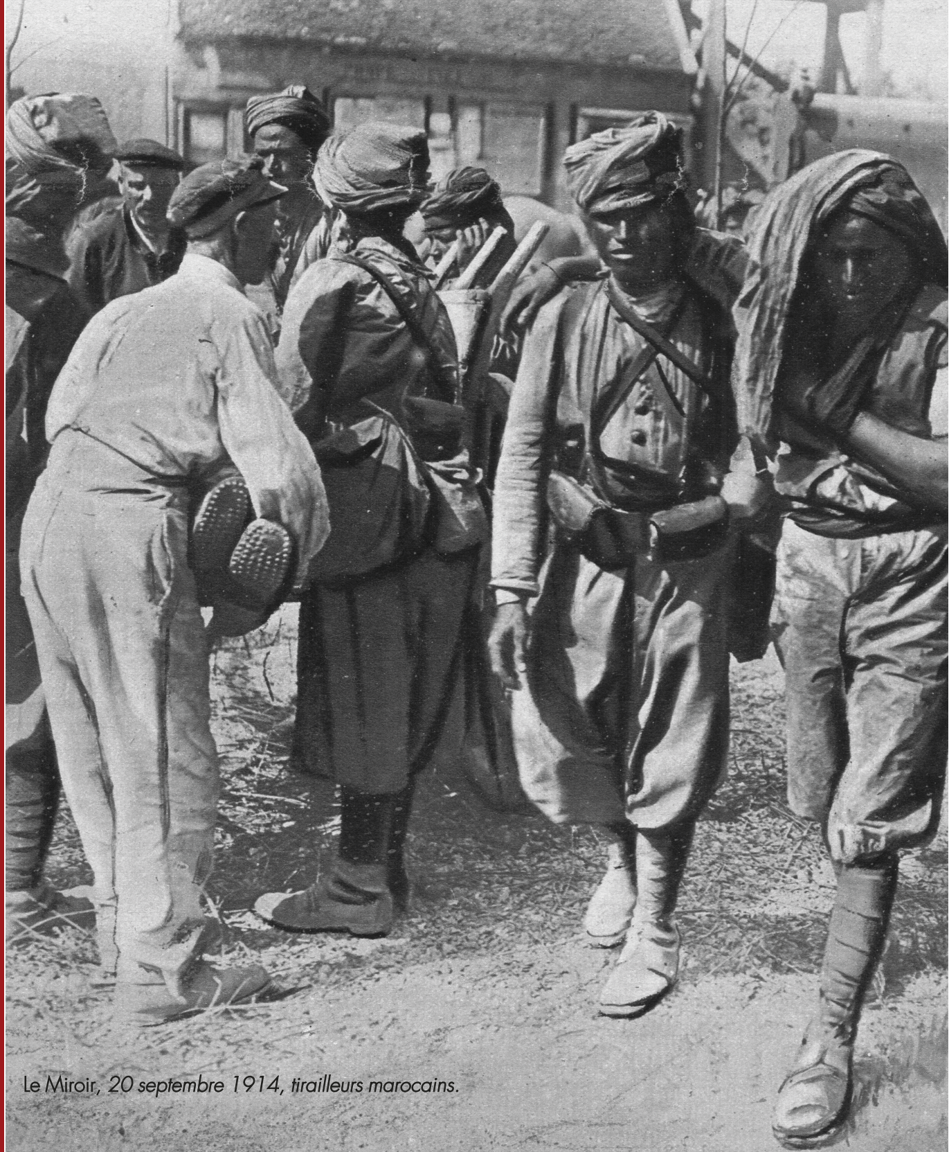
Le Miroir, 20 septembre 1914, tirailleurs marocains.