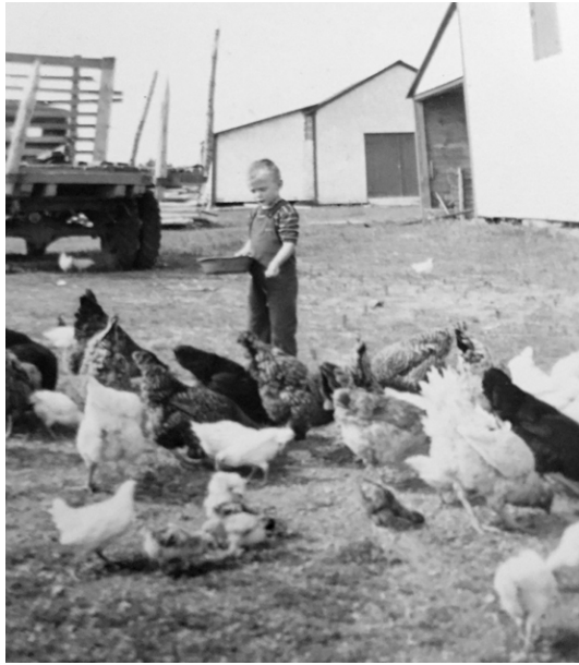
Vivre avec des poules, une image commune au début du siècle passé. Ici à la ferme de l'arrière-grand-père de l'auteure à Paspébiac, en Gaspésie.

confitures et des marinades, et tous les excellents repas qui nourrissaient sa famille. Cette vie familiale me connectait forcément avec la nature.