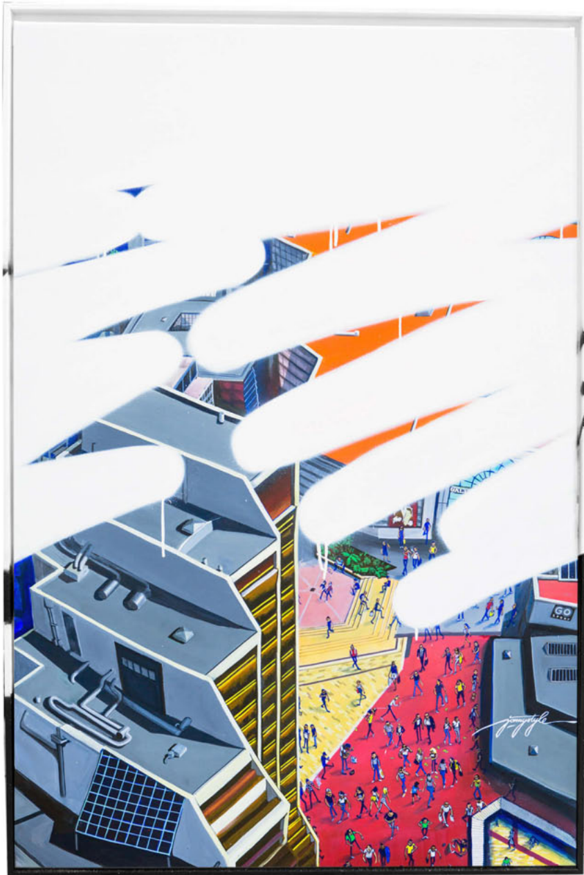
Monochrome n°34853. Acrylique sur toile. 146 x 97 cm Monochrome nb34853 – Acrylic on canvas. 146 x 97 cm