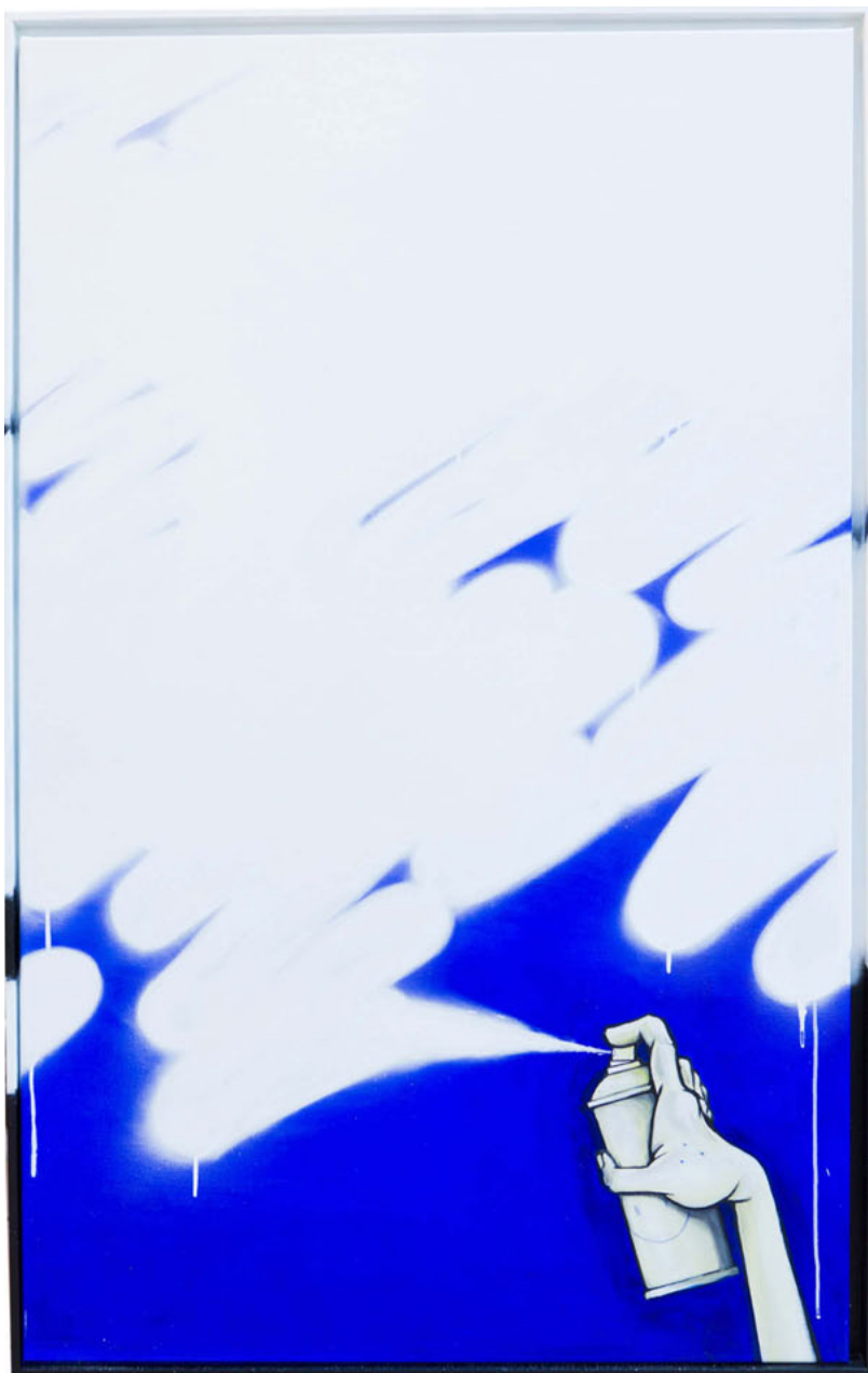
Monochrome n°34851 Acrylique sur toile. 146 x 89 cm Monochrome nb34851 – Acrylic on canvas. 146 x 89 cm