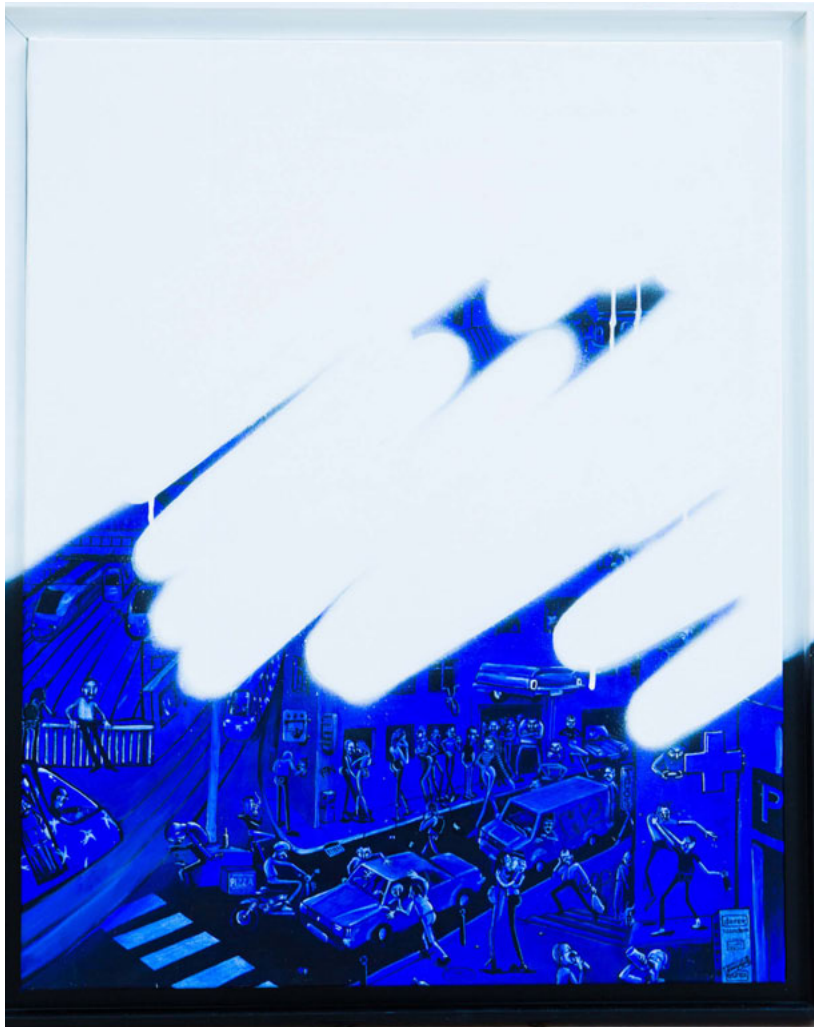
Monochrome n°34852. Acrylique sur toile. 81 x 65 cm Monochrome nb34852 – Acrylic on canvas. 81x 65 cm