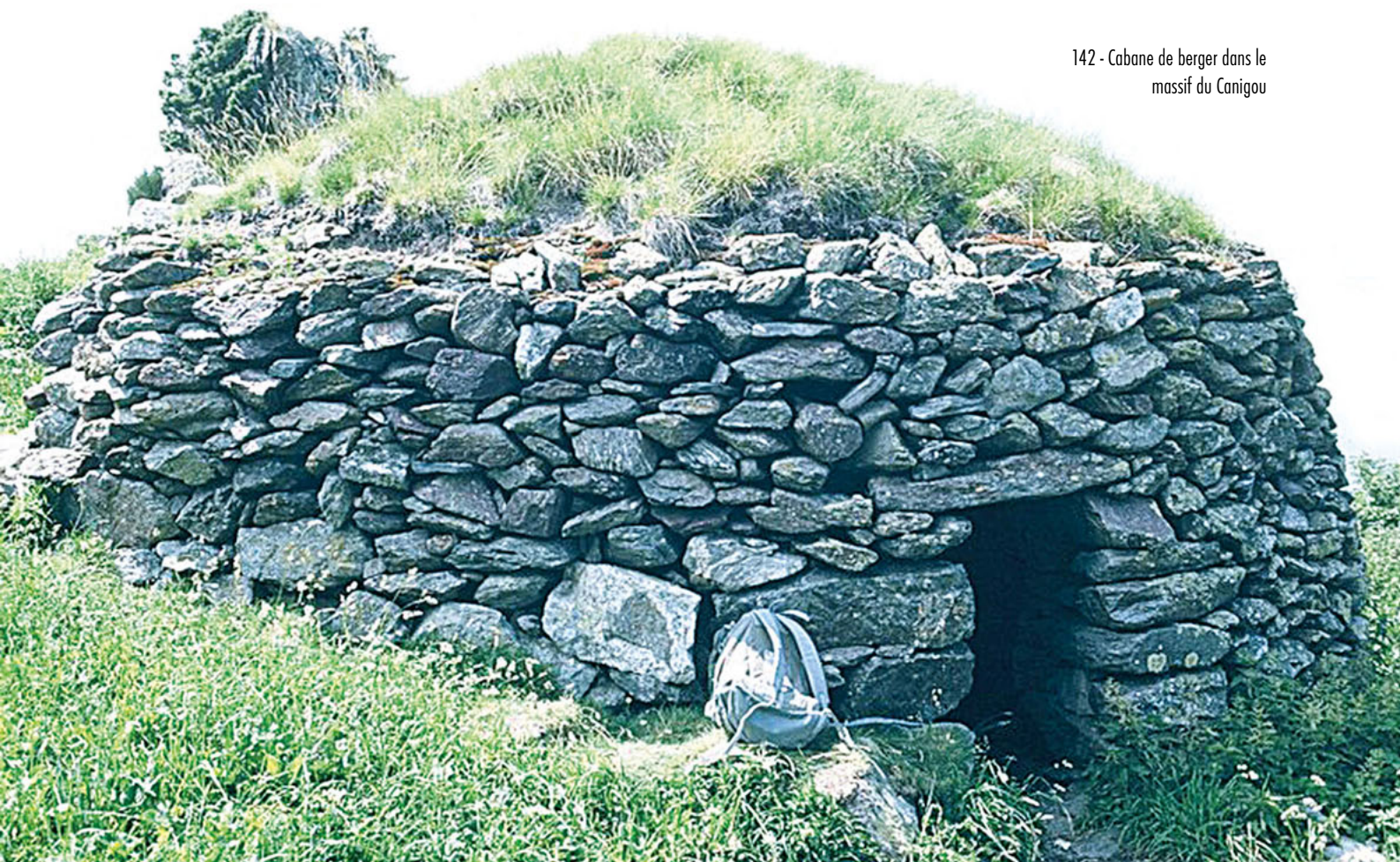
142 - Cabane de berger dans le massif du Canigou

Il existe actuellement un consensus pratiquement général des auteurs pour les désigner sous le terme générique de « cabanes ».