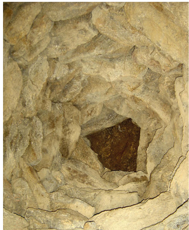
237 - Voûte en encorbellement près de chapelle Saint Martin

et dans deux plans perpendiculaires. Dans le plan horizontal les pierres, choisies les plus plates possible, sont disposées sur un même rang, la partie la plus étroite étant dirigée vers l'intérieur du cercle (un peu comme le sont, dans un plan vertical, les éléments d'un arc à claveau) ce qui les empêche de glisser vers l'avant. Chaque rang déborde, vers l'intérieur, le rang sous-jacent d'environ un tiers de sa largeur et chaque pierre est disposée, de façon plus ou moins régulière, à cheval sur deux pierres du strate inférieur qui sont solidarisées par le poids qu'elles supportent (237). Le poids du cailloutis entassé entre les parements intérieur et extérieur constitue une force verticale, dirigée de haut en bas, appliquée à l'arrière de la pierre plate, interdisant à celle-ci de basculer vers le bas