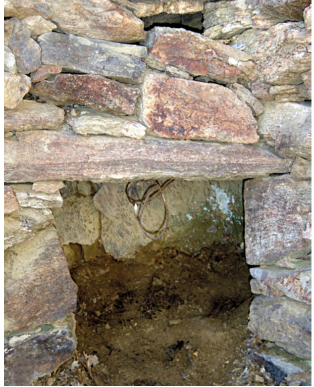
192 - Foyer de cheminée dans la cabane à La Roca den Talo

3°/ quelques cabanes ont été conçues, dès la construction, avec un foyer creusé dans l'épaisseur d'un mur. Profond et large d'une cinquantaine de centimètres et surmonté d'une cheminée rudimentaire (192), parfois ouverte sur sa face avant mais ne débouchant jamais à l'extérieur par un orifice bien individualisé dans la voûte. La fumée s'évacuait probablement par les interstices de la paroi postérieure du foyer, beaucoup moins épaisse que pour le reste de la construction.