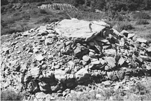
127 - Pierre plate fermant le sommet de la voûte

du côté intérieur. L'épaisseur des parois fait office de contrefort maîtrisant la poussée latérale de la voûte. Le sommet de celle-ci se termine non par un claveau mais par une simple dalle de pierre (127). Le déplacement de cette dalle afin de permettre l'évacuation de la fumée d'un feu allumé à l'intérieur de la cabane, souvent évoqué, semble être une hypothèse séduisante à priori. Toutefois cette explication ne paraît guère crédible, du moins pour les cabanes de notre canton, et ceci pour plusieurs raisons :