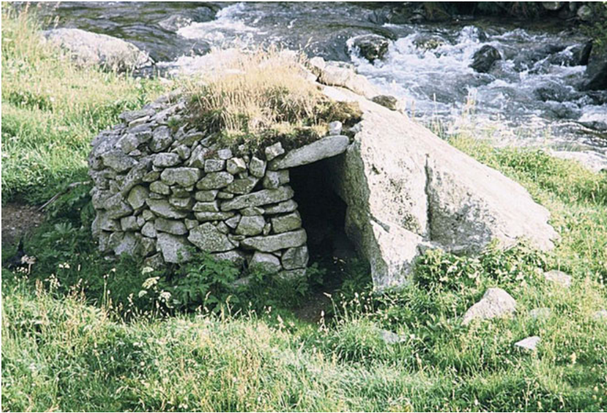
23 - Abri de berger dans la vallée du Campcardos