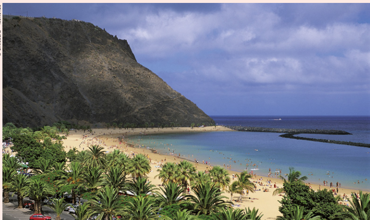
Playa de las Teresitas.

Les Canaries bénéficient tout au long de l'année d'une douceur climatique : climat chaud pour toutes les îles à l'exception d'un climat modéré pour le Nord de Fuerteventura et Lanzarote durant le printemps. Cependant, il ne fait jamais vraiment froid et il ne pleut que très rarement dans ces déserts arides. La moyenne des températures est assez élevée et varie de 20 à 22 °C