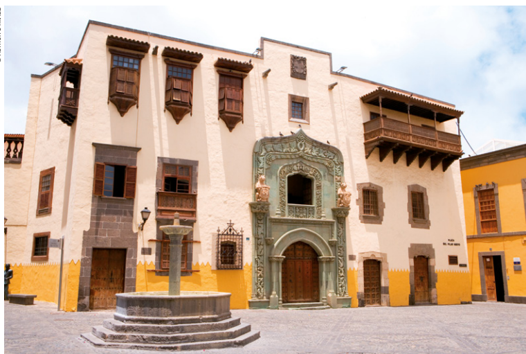
Casa de Colón (Christophe Colomb), dans le quartier de Vegueta à Las Palmas.

► Jour 6 : partez en direction de Vallehermoso, visitez le moulin à gofio, puis rendez-vous à Alojera pour passer une nuit au cœur de cette île sauvage, dans un petit village de pêcheurs. Au passage, profitez de la sublime vue panoramique depuis le sommet de la route.