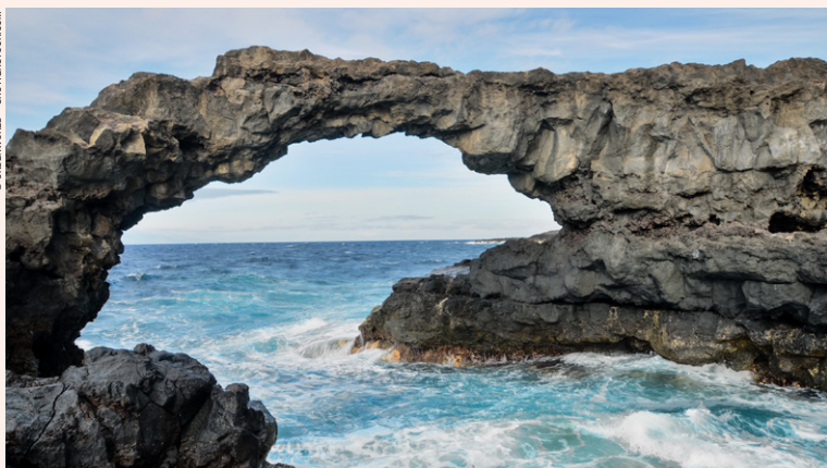
Arche naturelle de pierre à El Hierro.