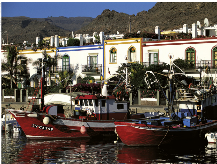
Port de Puerto Mogán.

Grâce à des plages de sable blanc et exposées au vent, les aficionados du kitesurfing trouveront un terrain et des écoles pour se régaler dans cette discipline ! Le tout sur fond d'eaux turquoise, ciel azur, dunes de sable, et d'arrière-plan volcaniques. Les randonneurs et adeptes du vélo ne seront pas en reste ! Les nombreux chemins et pistes cyclables, et mêmes certaines artères rapides autorisées aux vélos, permettent des balades inoubliables. Côté détente, le farniente, les nombreux spas et la thalasso-thérapie sauront vous requinquer !