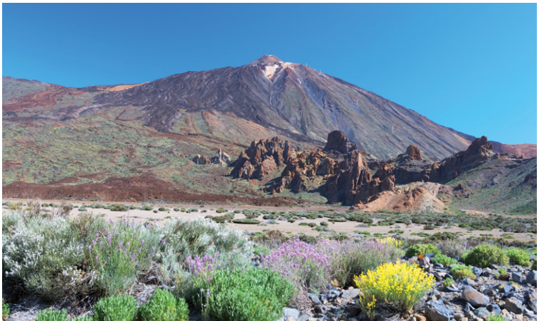
Parque nacional del Teide et pic du Teide.

► Gran Canaria , à l'environnement relativement pauvre et très dégradé, possède de nombreuses zones protégées, mais pas de parc national. On peut imaginer comme elle jalouse le Teide de son éternelle rivale, qui a contribué à ce que Tenerife devienne plus touristique qu'elle. D'excellents motifs politiques entrent donc sans doute en jeu dans le projet actuel d'un parc national à Gran Canaria, représentatif des différents milieux de l'île, également présents et protégés sur d'autres îles.