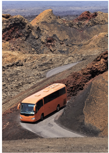
Bus touristique dans le désert Timanfaya.

Internationaux ou locaux, les loueurs de voitures sont innombrables. Vous en trouverez dans les aéroports et les ports d'arrivée des ferries, aussi bien que dans les villes et les centres touristiques. Cette concurrence garantit des prix peu élevés (environ 30 à 40 € par jour). Dans la plupart des agences possédant plusieurs points de location, on peut rendre le véhicule dans un autre lieu sans payer de surcoût. Attention ! Si certaines agences affichent un prix défiant toute concurrence, ne vous laissez pas aveugler. En effet, au prix indiqué, il faut parfois ajouter les assurances et les taxes ou vérifier qu'elles sont incluses dans le prix. Il est peu intéressant d'amener son propre véhicule par le car-ferry de Cadix. Et n'oubliez pas : l'essence est beaucoup moins chère qu'en France. Mieux vaut également changer de voiture en changeant d'île, de manière à économiser le passage du véhicule sur le car-ferry, ou même pour prendre un moyen de déplacement plus rapide (hydroglisseur ou avion).