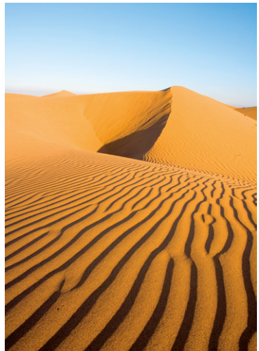
Les dunes de Maspalomas, au sud de Gran Canaria.