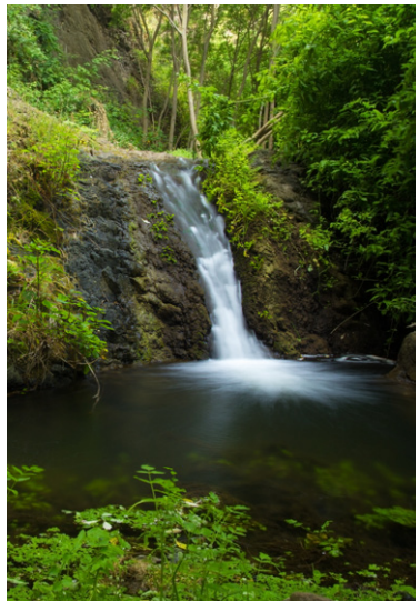
Petite cascade, réserve naturelle de Barranco de Azuaje entre Moya et Firgas, Gran Canaria.