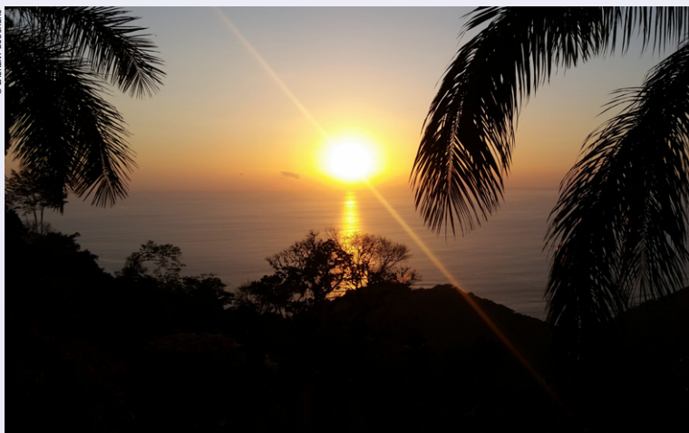
Magic sunset !