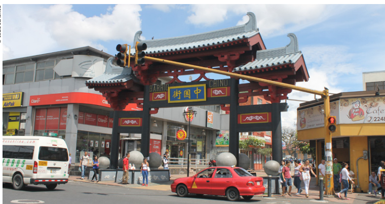
Barrio Chino, San José.