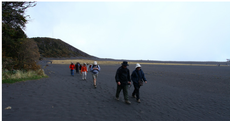
Cratère playa Hermosa, Parc national Volcan Irazu.

► Autre adresse : 20 rue du Rempart-Saint-Etienne – 31000 Toulouse ☎ 05 67 31 70 00