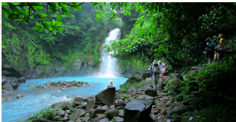
Catarata Río Celeste, dans le parc national du volcan Tenorio.

Grâce aux membres du réseau solidaire, ToutCostaRica s'est imposé comme le spécia- liste du 4x4 au Costa Rica ! Leur équipe négocie pour vous des tarifs transparents et sans surprise, tout en privilégiant les loueurs locaux et le commerce équitable. Une assistance télé- phonique 24h/24 en français vous est également proposée pour toute la durée de votre séjour. Une référence pour les francophones dans l'organisation et la réussite de votre voyage. ToutCostaRica vous apporte la garantie des prix annoncés et la qualité des véhicules proposés. Livraison gratuite de votre 4x4 dans l'une de leurs bases d'accueil, chez Pierre, à l'aéroport, à votre hôtel et dans tout le pays.