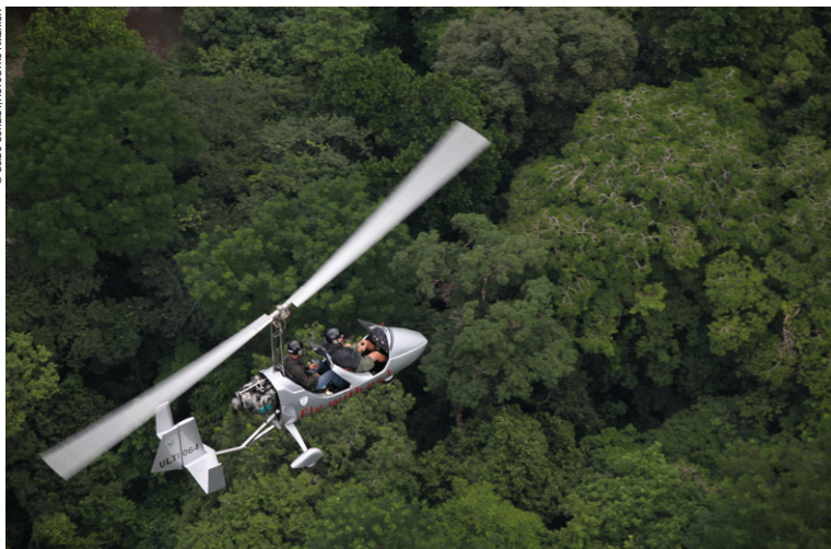
Vol au dessus de la jungle, Samara.

Un spécialiste des voyages culturels avec conférencier en Europe et dans le monde. Depuis près de 25 ans, Intermèdes crée des voyages sur des routes millénaires. Conçus dans un esprit