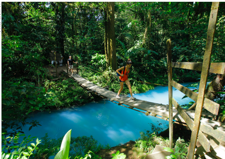
Pont sur le Rio Celeste dans le parc national Tenorio.

Il n'y a pas d'armée et pas de putsch. Le respect des gens, de la nature, de la vie, la paix sociale et la démocratie sont bien ancrées dans le pays, comme en témoigne la devise nationale : « ¡ Vivan siempre el trabajo y la paz ! » (Que vivent à jamais le travail et la paix !). La nature même est clémente car, si le risque d'éruptions volcaniques est toujours présent, il n'y a pas de cyclone au Costa Rica, fait remarquable pour un pays tropical de la région Caraïbe. Enfin, en conclusion, on peut dire qu'il s'y dégage une philosophie de vie que caractérise bien le slogan national « Pura vida ».