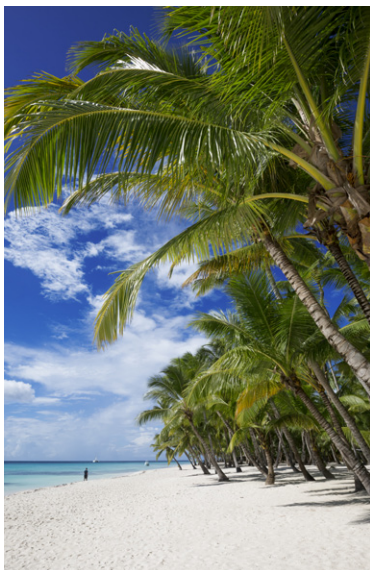
Plage du Costa Rica.

Malgré sa position tropicale, qui devrait garantir au Costa Rica une certaine uniformité climatique, on peut trouver ici plusieurs climats liés