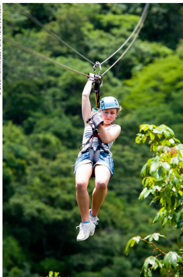
Parc nacional Manuel Antonio.