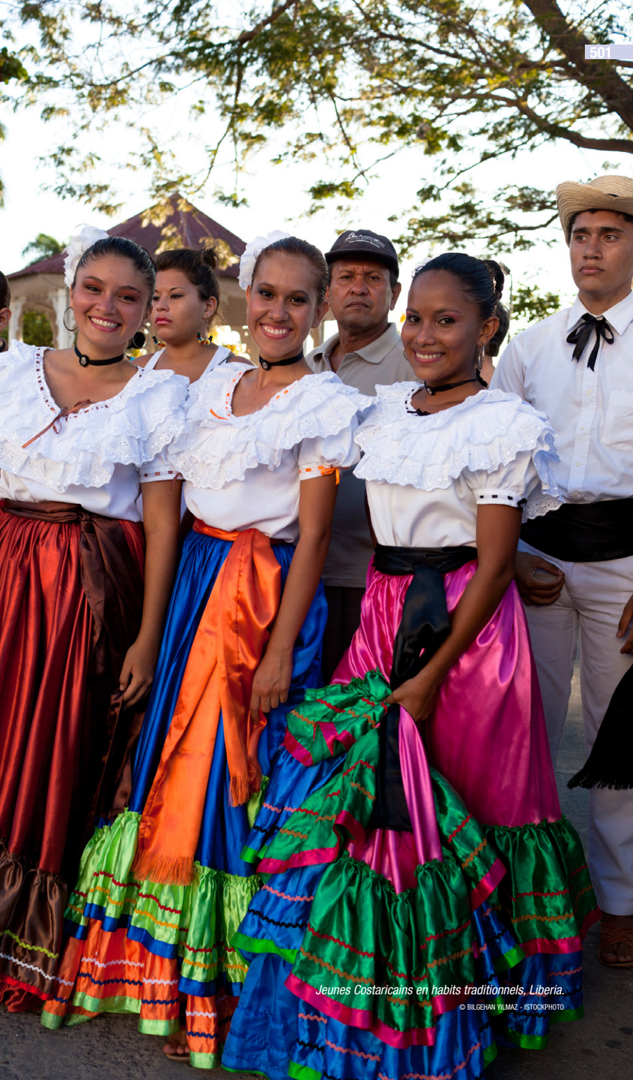
Jeunes Costaricains en habits traditionnels, Liberia.