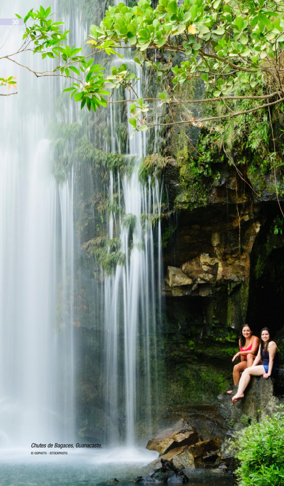
Chutes de Bagaces, Guanacaste.