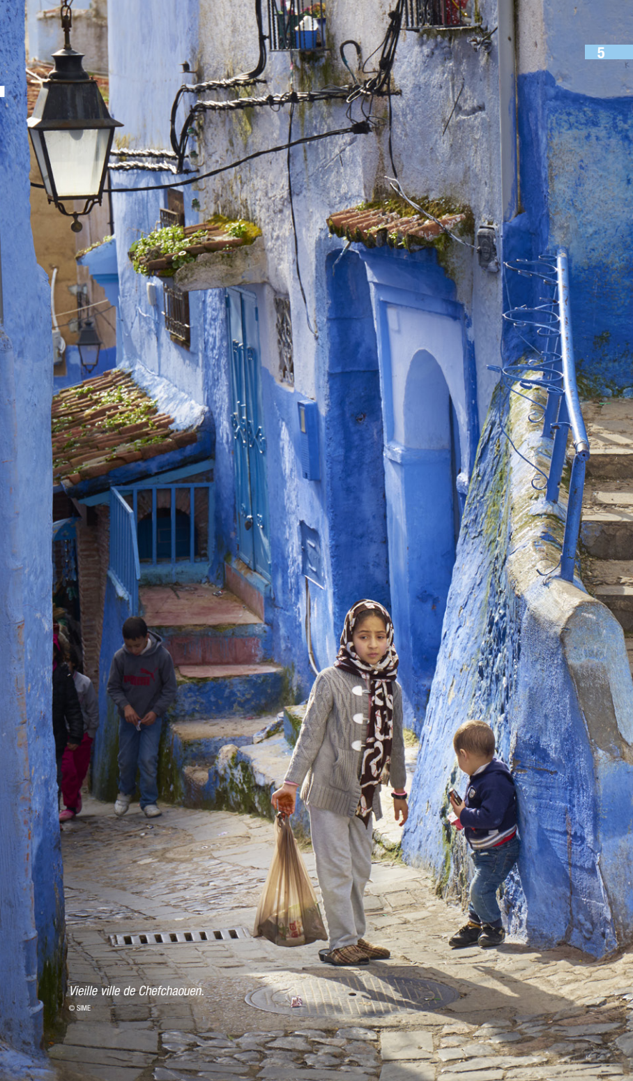
Vieille ville de Chefchaouen.