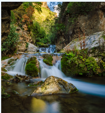
Les cascades d'Akhour dans le parc national de Talassemrane.