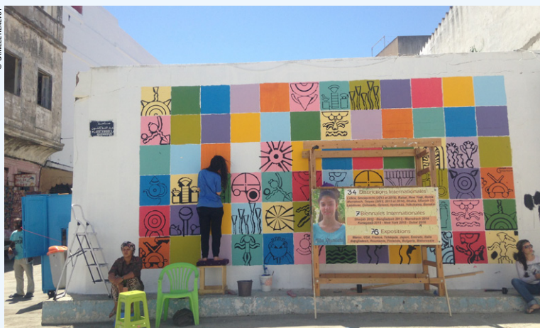
Les peintures d'Asilah.