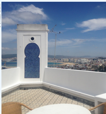
Terrasse avec vue.