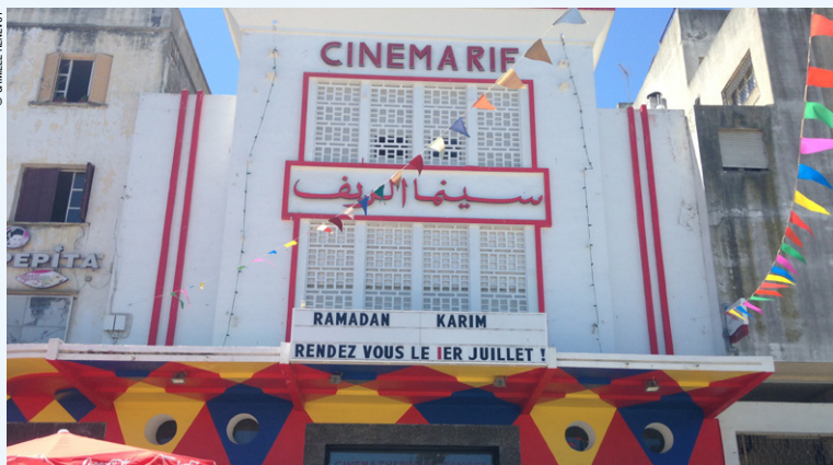
Devanture de la Cinémathèque, Place 9 Avril.