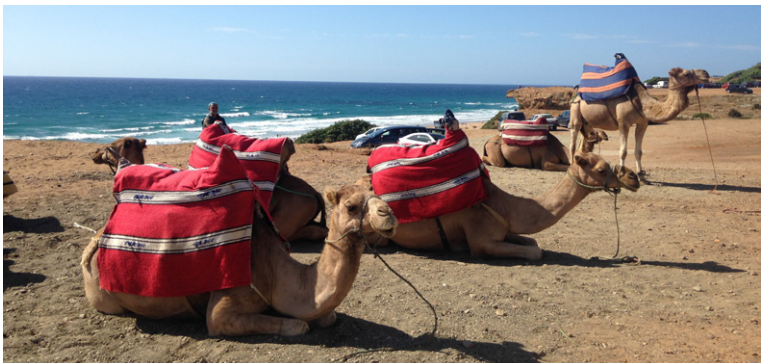
Chameaux sur la plage d'Achakar, dans les environs de Tanger.

A Casa Barata, vous découvrirez l'un des derniers cimetières juifs encore ouverts au Maghreb, un lieu surprenant et paisible. C'est à Casa Barata également que vous pourrez visiter le vrai marché aux puces de Tanger et l'une des friperies les plus fréquentées, sans aucun danger pour les touristes étrangers : au contraire, en vous y aidera à dénicher les bonnes affaires !