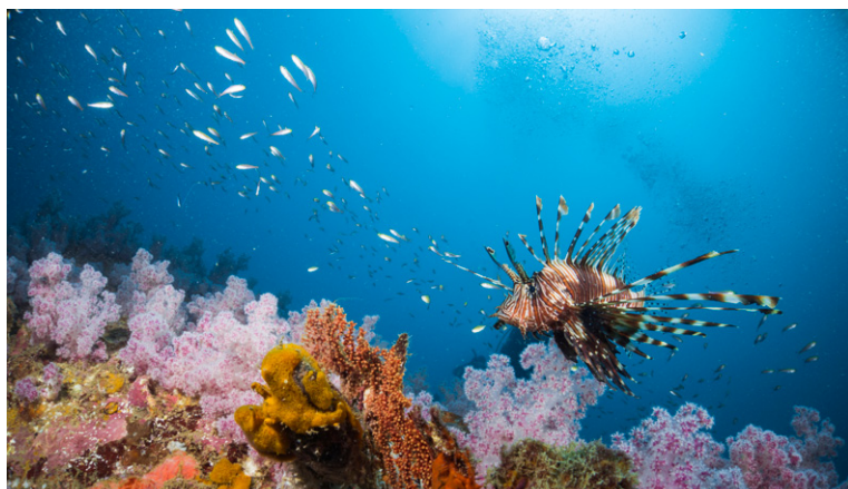
Les fonds sous-marins thaïlandais.

Ce pays, dont la forme géographique ressemble à une grande tête d'éléphant de profil, a fait de cet animal son symbole national. À celui-ci s'ajoutent de nombreux mammifères (singes, buffles, tigres, léopards...) qu'il vous sera possible d'apercevoir dans certains parcs nationaux du pays. Les côtes regorgent de poissons et autres animaux marins multicolores. La diversité des paysages et des espèces naturelles de Thaïlande est remarquable. La Thaïlande recense sur son territoire près de 10 % des essences connues dans le monde des orchidées, lotus et autres bougainvilliers. Les massifs calcaires dressés dans les eaux turquoise des îles du Sud constituent un décor paradisiaque qu'il faut voir au moins une fois dans sa vie. Les paysages et les sites historiques ou religieux se succèdent comme dans un songe, d'une beauté extrême et d'une variété sans pareille.