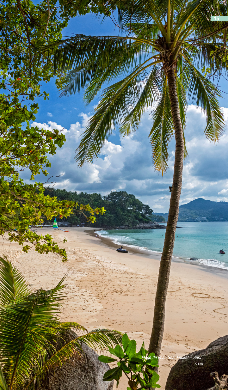
Plage de Phan Sea, Phuket – Surin.