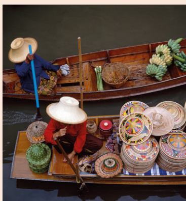
Marché flottant de Damnoen Saduak.