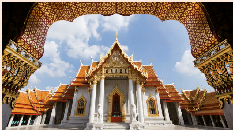
Wat Benchama Bophit, ou le temple de Marbre à Bangkok.