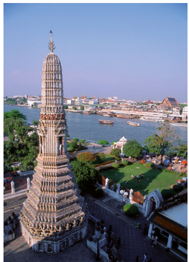
Vue du Wat Arun sur le fleuve Chao Phraya.