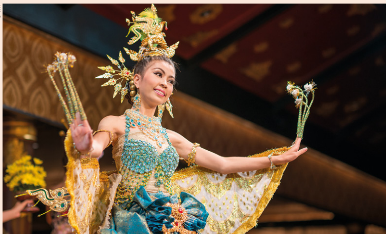
Danse thaïlandaise traditionnelle.