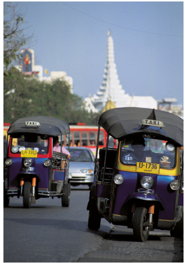
Touk-touk à Bangkok.

Il s'agit d'un taxi collectif avec deux bancs latéraux installés dans un pick-up couvert, avec accès par le marchepied arrière. Certains,