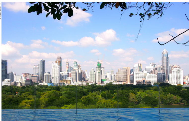
Skyline de Bangkok vue de la piscine d'un hôtel.

► Jours 10 et 11 : Koh Tao. Après avoir profité des plages de Koh Phangan, il est dorénavant temps de s'essayer – ou de se perfectionner – à la plongée. Koh Tao compte près d'une centaine de clubs, les meilleurs étant recensés dans votre guide. Et si un baptême de plongée vous effraie, il est possible d'effectuer une sortie d'une journée en bateau afin de s'adonner au snorkeling dans les meilleurs spots de l'île, notamment autour de Koh Nang Yuan.