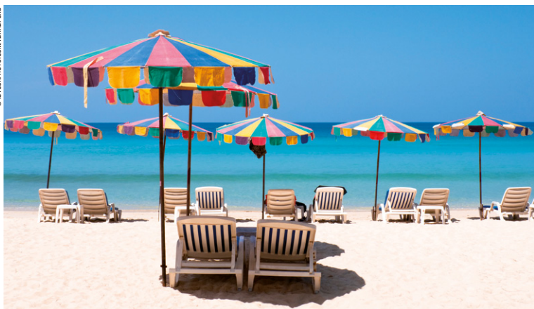
Plage de Phuket, Chalong Bay.