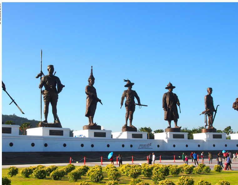
Les statues géantes des 7 premiers grands rois de Thaïlande dans le nouveau parc de Ratchapakdi.