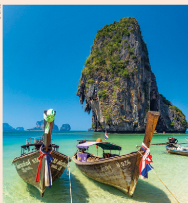
Bateaux à longue queue près des grottes de Phra Nang.