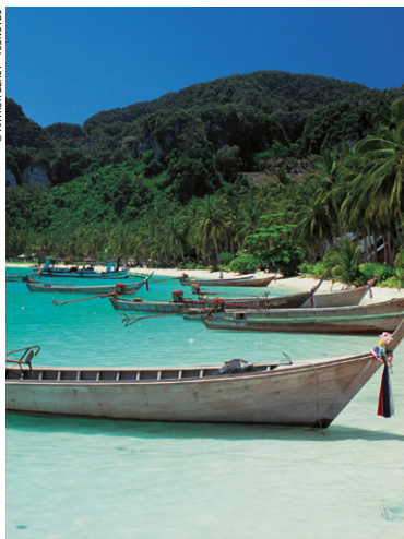
Barques traditionnelles sur la plage de la baie de Phang Nga.