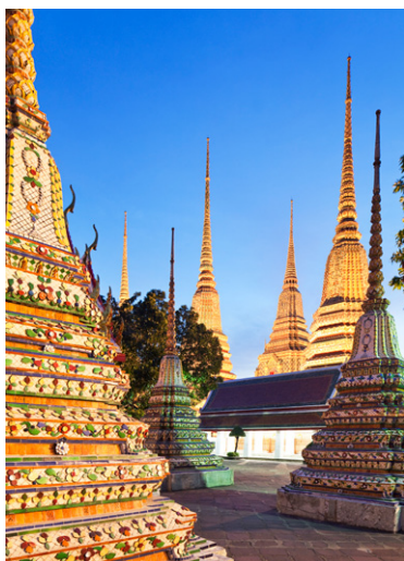
Wat Pho à Bangkok.

► Jours 8, 9 et 10 : Koh Phangan. Planifiez votre visite en fonction des dates de la Full Moon Party, que vous vouliez y assister ou, au contraire, l'éviter. À ne pas manquer : la visite des chutes de Than Sadet et se prélasser sur la superbe plage du même nom, dîner dans l'un des excellents restaurants de l'île, explorer les plages uniquement accessibles en bateau, excursion en bateau au parc maritime Ang Thong, et, pour les plus festifs d'entre vous, faire la fête toute la nuit à la Full Moon Party.