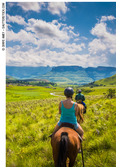
Randonnée équestre dans le Royal Natal national park.

Oubliez les séjours bateaux et les tours impersonnels. Avec Biwakwango c'est une journée sur mesure et selon votre profil qui vous sera proposée. Visites, balades à cheval, randonnées, dégustations de vin et fromage, les options sont nombreuses. L'agence vous amène aussi dans les recoins de l'Afrique du Sud et même au-delà de ses frontières. Avec une démarche écologique et solidaire, l'idée