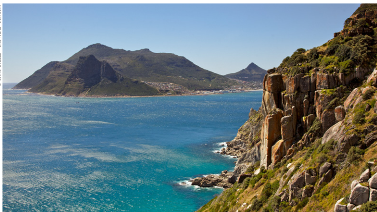
Chapman's Peak Drive.