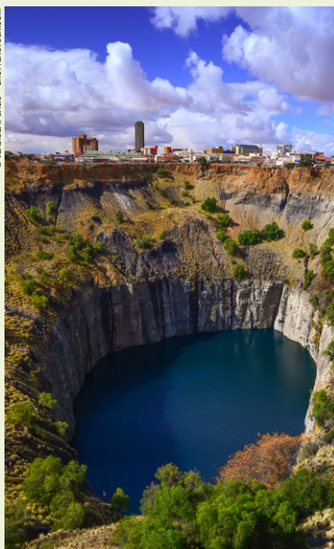
Big Hole Complex.