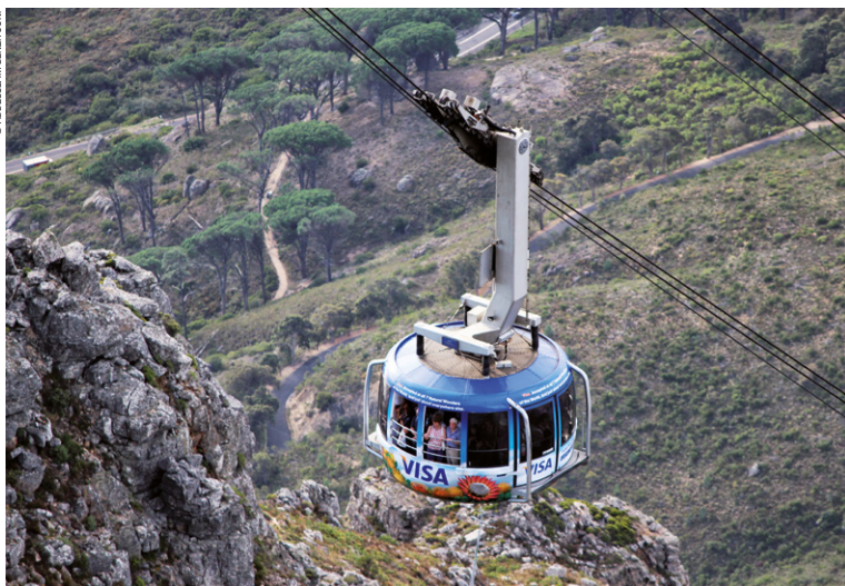
Le téléphérique de Table Mountain.