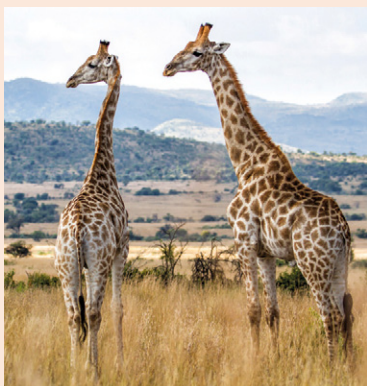
Girafes du parc national de Pilanesberg.