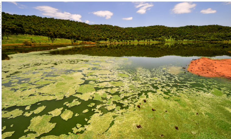
Cratère de Tswaing.

► Au sud-est , la région côtière, qui sépare le grand escarpement rocheux de l'océan Indien, est une région chaude été comme hiver dans