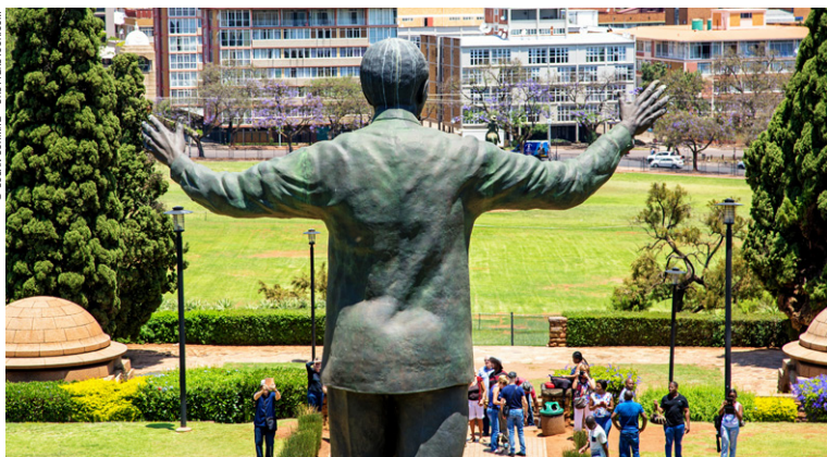
Statue de Nelson Mandela, Pretoria.

L'Afrique du Sud présente une richesse culturelle hors du commun. Avec onze langues officielles, des traditions européennes chrétiennes, une culture africaine tribale synchrétique, des descendants d'esclaves musulmans et des indiens hindouistes, c'est bien d'une « nation arc-en-ciel » qu'il s'agit. Ne manquez pas de vous imprégner des senteurs du marché indien de Durban, des fêtes traditionnelles zoulous ou xhosa dans les villages, des soirées branchées à l'occidentale au Cap et plus cosmopolites à Johannesburg.