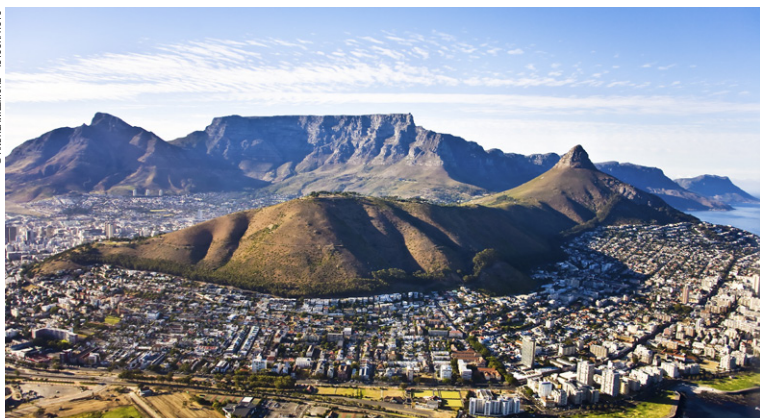
Vue aérienne du Cap.