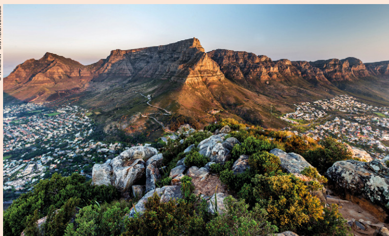
Le parc national de Table Mountain.