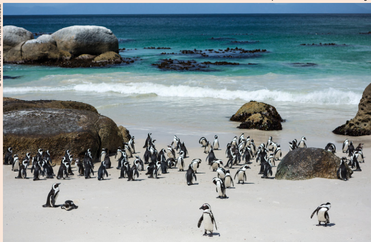
Colonie de pingouins sur la plage de Boulders.