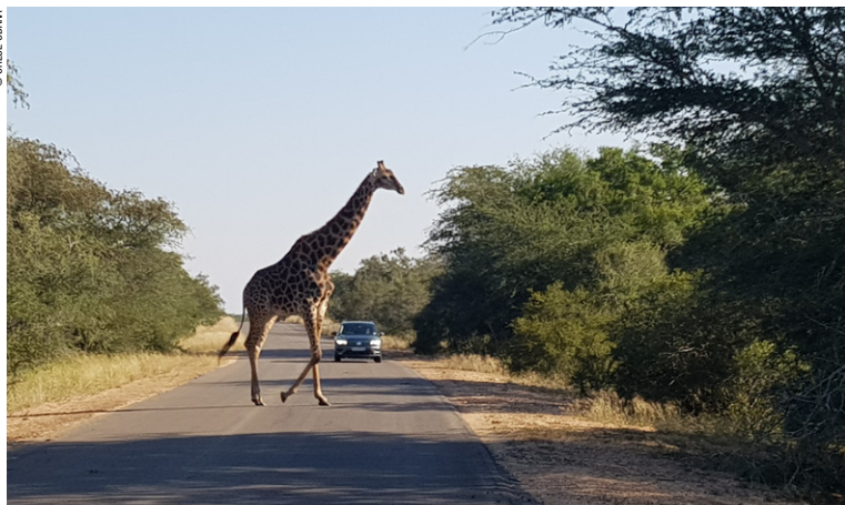
Girafe au parc Kruger.