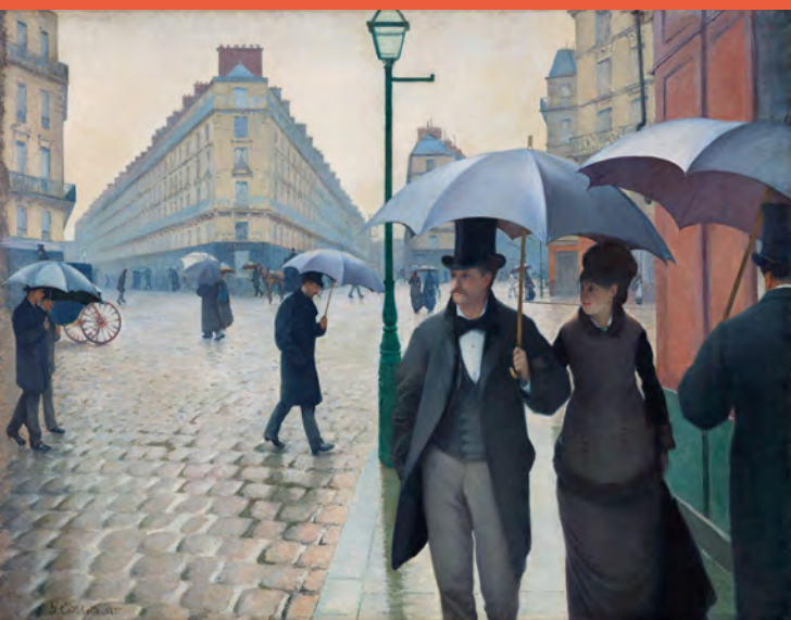
Gustave Caillebotte, Rue de Paris, jour de pluie , 1877, huile sur toile, Art Institute, Chicago.