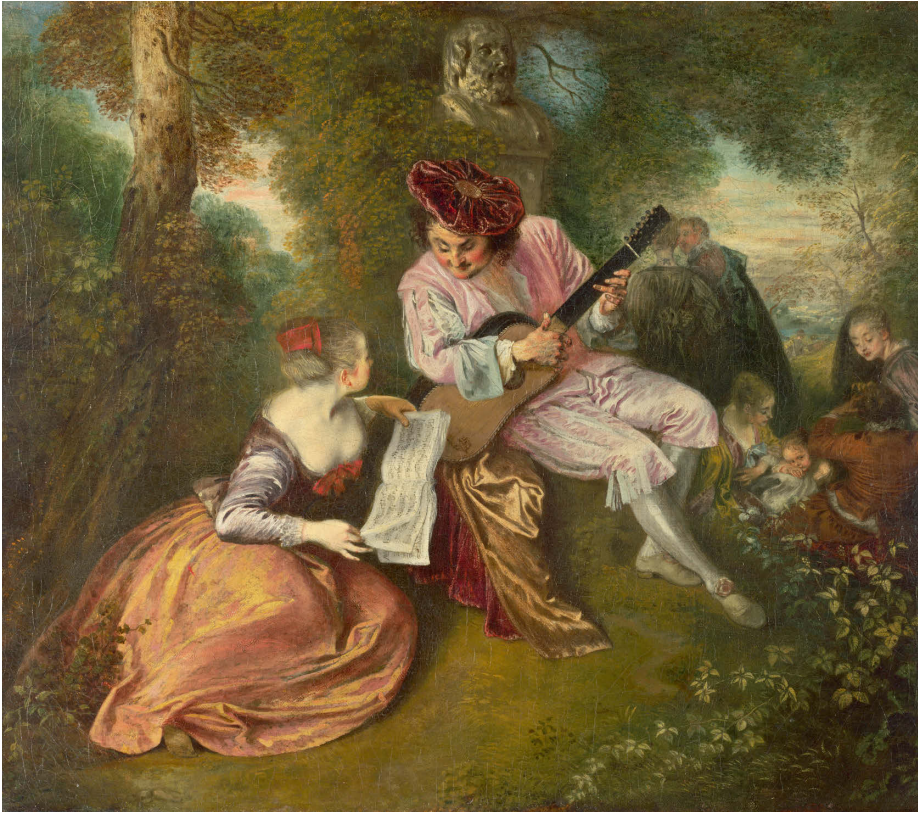
Antoine Watteau, La Gamme d'amour , huile sur toile, 1717, National Gallery, Londres.