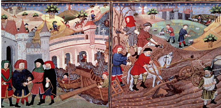
Miniature tirée du Livre du régime des princes de Gilles de Rome, XIII e siècle, BnF, Paris.