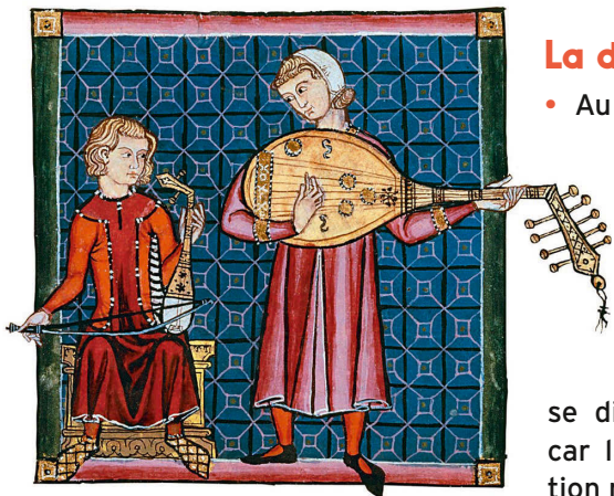
Miniature tirée des Cantigas de Santa Maria , vers 1280, bibliothèque de l'Escurial.

coûteux. Les textes sont copiés à la main sur du parchemin et illustrés sous forme de miniatures ou de lettres enluminées .