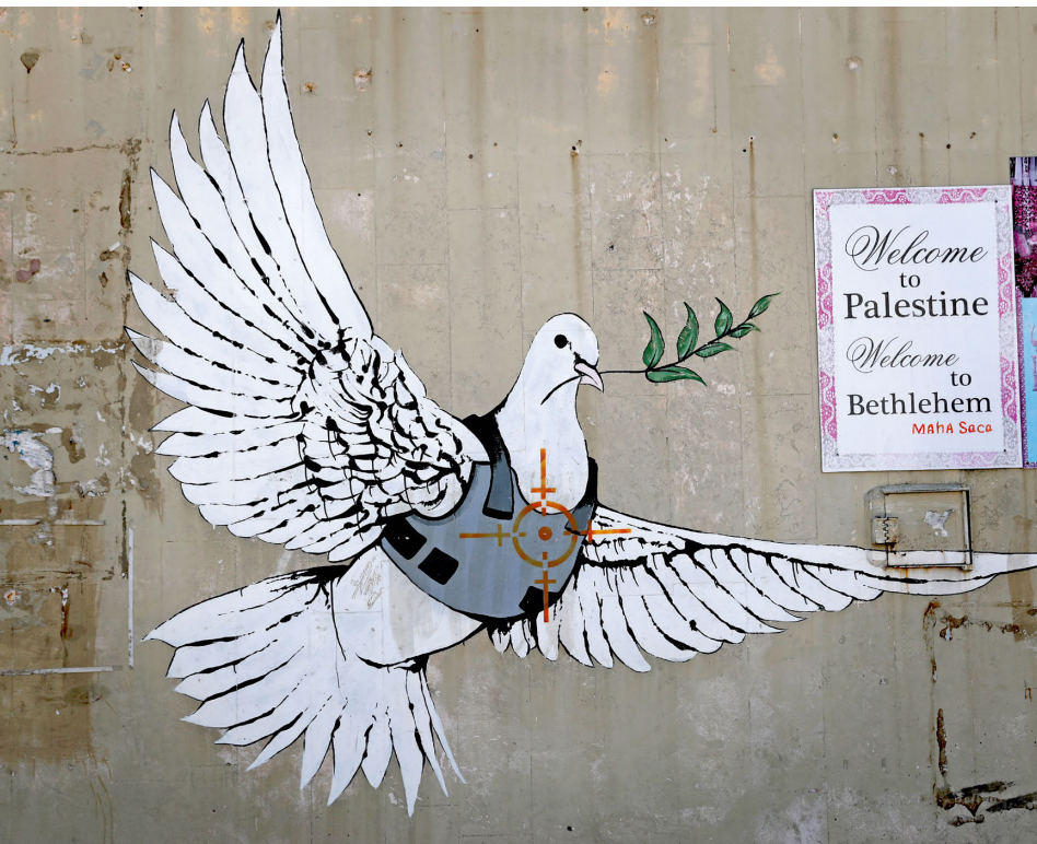
Banksy, La Colombe sous les balles , 2005, Bethléem (Cisjordanie).