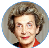
Andrée Chédid (1920-2011)