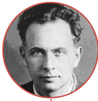
Louis Aragon (1897-1982)