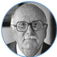
Jean Tardieu (1903-1995)