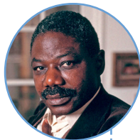
Tchicaya U Tam'si (1931-1988)