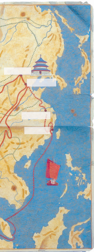
Anonyme, Le Trajet de Marco Polo relaté dans Le Livre des Merveilles , illustration, 1900.