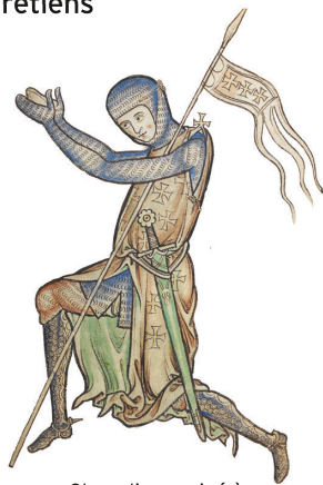
Chevalier croisé à genoux, illustration du Psautier de Westminster, XIII e siècle.